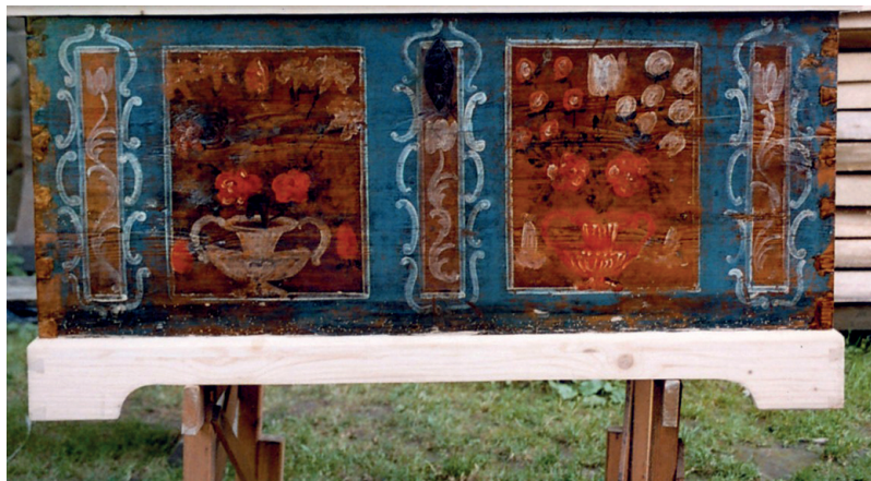
Fot. 2. Skrzynia nr MR/E 488, stan w trakcie konserwacji