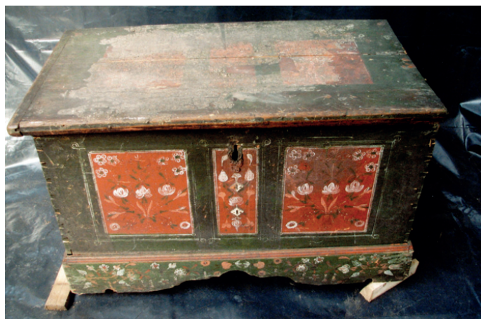
Fot. 5. Skrzynia nr MR/E 1774, stan przed konserwacją

z Bieńkowic (powiat raciborski), wykonano z drewna iglastego łączonego za pomocą czopów, dno przytwierdzono kołkami, boki i front ozdobiono polichromią wykonaną w technice olejnej na zaprawie kredowo-klejowej. Drewno skrzyni było mocno naruszone przez owady, złącza desek rozესchnięte i luźne, zachowały się tylko trzy kołka oderwane od całości, z których jedno było niewymiarowe. Żelazne uchwyty i zamek pokryte były rdzą. Stwierdzono spore ubytki zaprawy kredowo-klejowej pod polichromią. Na wieku znajdowało się bardzo duże zaplamienie (fot. 5). Założono przeprowadzenie konserwacji technicznej i częściowo estetycznej. Polichromię wieka odczyszczano mechanicznie, zdejmując kolejne warstwy skalpelem. Naprawiono podstawę skrzyni, zrekonstruowano kołka i oś oraz listwę blatu w drewnie świerkowym. Mniejsze ubytki drewna uzupełniono kitem trocinowym firmy Sintilor. Sklejono pęknięcia i złącza drewna klejem stolarsko-kostnym (klejenie podstawy i listwy blatu wzmocniono kołkami bukowymi). Na dorobione elementy oraz w miejscach przetarć nałożono zaprawę kredowo-klejową. Po jej wyschnięciu nałożono warstwę werniksu damarowo-woskowego i uzupełniono polichromię metodą punktowania płamką lub kreską. Użyto odsączonych z nadmiaru spoiwa farb olejnych (cynober ciemny, lazur zielony, żółć kadmowa, zieleń chromowa ciemna, umbra, sepia, czerń lampowa) rozcieńczonych terpentyną wenecką. Metalowe części odczyszczono i zabezpieczono capon-lakiem 29 .