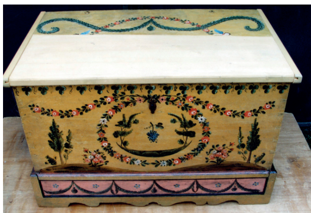
Fot. 6. Skrzynia nr MR/E 480, stan po konserwacji

W 2009 roku przeprowadzono konserwację kolejnych dwóch skrzyń ze zbiorów raciborskiego muzeum – nr inw. MR/E 301 pochodzącą z terenu Śląska Opolskiego z XIX wieku oraz nr inw. MR/E 222 ze zbiorów przedwojennego Heimatmuseum in Ratibor. Postępowanie konserwatorskie prowadzone było podobnie, jak przy obiektach opisywanych uprzednio. Oczyszczono i zdezynfekowano oraz wzmocniono części drewniane skrzyń. Zrekonstruowano brakujące elementy w drewnie świerkowym, uzupełniono mniejsze ubytki kitem trocinowym. Nałożono na dorobione elementy oraz w miejscach przetarć zaprawę kredowo-klejową, po jej wyschnięciu – warstwę werniksu damarowo-woskowego i uzupełniono polichromię metodą punktowania płamką lub kreską. Użyto odsączonych z nadmiaru spoiwa farb olejnych (cynober ciemny, lazur zielony, żółć kadmowa, zieleń chromowa ciemna, umbra, sepia, czerni lampowa), rozcieńczonych terpentyną wenecką 32 .