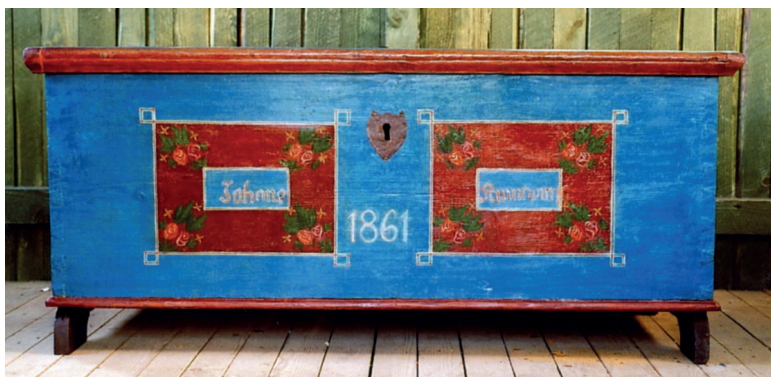
Fot. 4. Skrzynia nr MR/E 303, stan po konserwacji

malowane w małe kwadraciki utworzone przez pionowe i faliste kreseczki, tworzące imitację splotu kosza. Na wieku znajdował się namalowany ornament kwiatowy biegnący przez jego środek. W trakcie prac okazało się, że pod obecną warstwą polichromii znajduje się pierwotna malatura z XIX wieku. W związku z tym, że warstwa polichromii pierwotnej zachowała się w dość dobrym stanie delikatnie ściągnięto przemalowania za pomocą skalpela. Na ścianie frontowej odsłonięto dwa prostokątne pola zdobnicze z motywem róży w narożach, pomiędzy prostokątami odkryto datę 1861 oraz imię i nazwisko prawdopodobnego właściciela Johane Ruintwur [?] (fot. 4). Klejem kostnym połączono pęknięte części skrzyni, wzmacniając je kołkami. Odczyszczoną polichromię zabezpieczono werniksem retuszującym i przystąpiono do punktowania. Drobne ubytki wypełniono nieregularną kropką, większe uzupełniono kreską na lekkim podlawianiu. Użyto odsączonych z nadmiaru spoiwa farb olejnych (ugier jasny, umbra naturalna, cynober jasny, ultramaryna ciemna, błękit paryski), rozcieńczonych terepentyną wenecką. Po wyschnięciu nałożono werniks woskowy firmy Maimeri 28 .