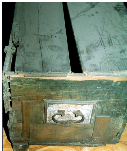
Fot. 1. Skrzynia ludowa malowana, MR/E 481, stan przed konserwacją

Skrzynia nr MR/E 481 była mocno zniszczona przez szkodniki biologiczne, drewno było rozeschnięte i popękane, w wielu miejscach występowały uszkodzenia mechaniczne. Elementy metalowe były skorodowane (fot. 1). Polichromia zachowała się fragmentarycznie, najlepiej na ścianie frontowej, a na płaszczyznach bocznych – śladowo, brakowało jej na wieku i z tyłu skrzyni. Polichromia wykonana została farbami temperowymi bezpośrednio na drewnie, jedynie w niektórych partiach ściany przedniej – na warstwie bardzo cienkiej zaprawy kredowej.