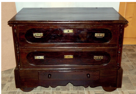
Fot. 7. Skrzynia-pseudokomoda nr MR/E 1775, stan po konserwacji

wiejskiej. W 2. połowie XIX wieku zaczęto przerabiać istniejące malowane skrzynie ludowe, by upodobnić je do miejskich komód. Skrzynia nr inw. MR/E 1775 pochodząca z Raciborza ma od frontu imitację szuflad, ale otwierana jest tradycyjnie od góry – wiekiem (fot. 7). Zachowały się w niej pierwotne, tradycyjne elementy konstrukcyjne skrzyni – kółka, drewniane osie, półskrzynek, które nie występują w przypadku komody. W trakcie konserwacji odkryto, że imitację płycin i szuflad oraz fladrowanie położono na pierwotną polichromię z podziałami geometrycznymi i ornamentami roślinnymi, które niestety zachowały się śladowo (na bokach około 40%, na frontowej ścianie 5%, na wieku niezachowana). W związku ze słabym zachowaniem pierwotnej polichromii podjęto decyzję, że w ramach konserwacji estetycznej zostanie odczyszczzone i uzupełnione fladrowanie skrzyni. Po wyschnięciu zaprawy nałożono warstwę werniksu damarowo-woskowego i uzupełniono polichromię farbami olejnymi rozcieńczonymi terpentyną wenecką techniką punktowania płamką lub kreską, następnie położono laserunek imitujący słoje drewna. Rekonstruowane elementy drewniane scalono kolorystycznie z drewnem oryginalnych części za pomocą brązowej bejcy do drewna firmy Sintilor i zawoskowano 34 .