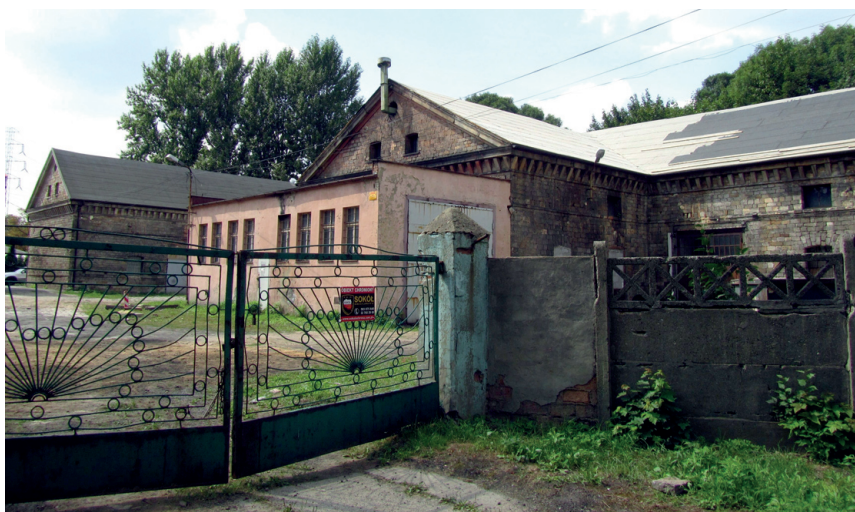
Fot. 2. Zabudowania folwarku w Katowicach-Dąbrówce Małej