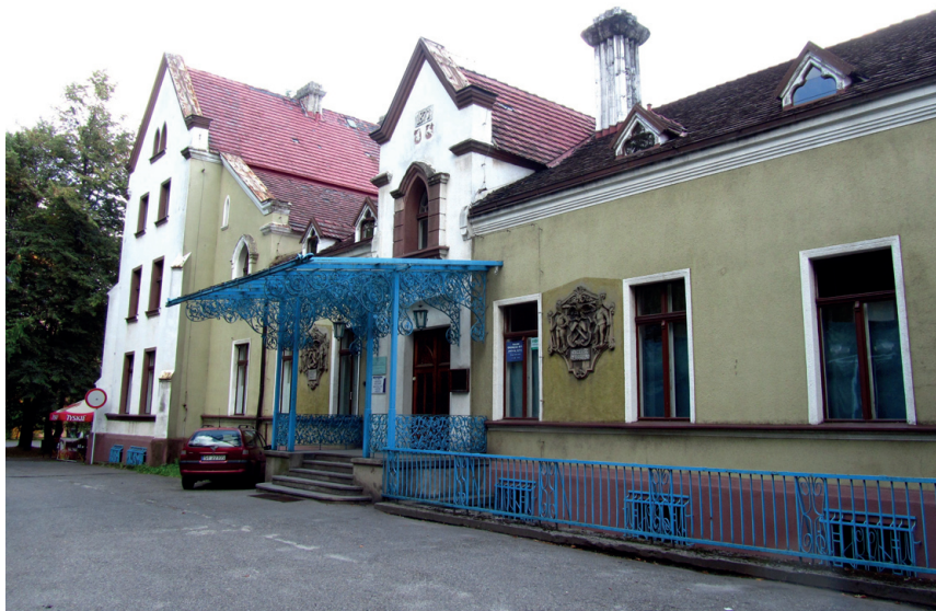
Fot. 1. Pałac w Siemianowicach Śląskich-Michałkowicach

(Czerwionka-Leszczyny-Czerwionka), neorenesansu włoskiego (Zabrze-Rokitnica) lub niemieckiego Landhaus (Orzesze-Gardawice). Widać też rozwiązania zmierzające w kierunku nowych stylów początku XX wieku (Katowice-Załęże).