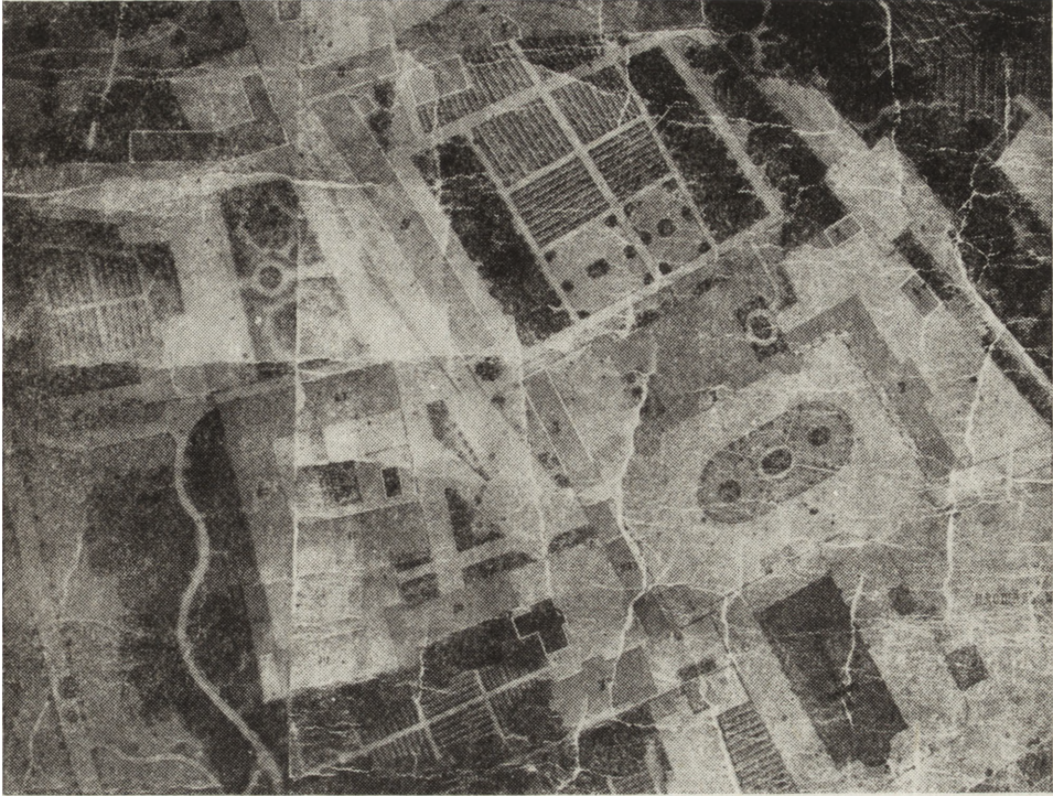
Ryc. 3. Fragment planu Kielce z 1872 r. przechowywanego w Wojewódzkim Archiwum Państwowym w Kielcach

dynków jest znany nader ogólnie. Były budynek starosty (ryc. 4, nr 2 — od tego miejsca, jeśli specjalnie tego nie zaznaczono, podawana numeracja dotyczy wyłącznie ryc. 4) zajęto na biura i mieszkania, zaś stajnie i wozownie (nr 1) używano zgodnie z pierwotnym ich przeznaczeniem, konie bowiem i pojazdy były niezbędne przy zarządzaniu podległymi Dyrekcji dobrami roz-