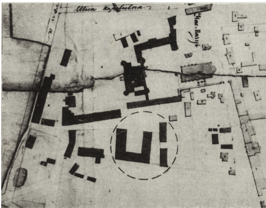
Ryc. 2. Fragment planu Kielc z 1823 r.

sufit i podłogę z desek, a pierwotny piec z zielonych kafli zastąpiono z czasem murowanym z cegły, wyposażonym w kominek i piec chlebowy. Nie nazwane w inwentarzach pomieszczenie w południowym krańcu zachodniego traktu oddzielało od izby czeladnej proste przepierzenie. Było tu oszklone okno, a powała i podłoga jak w poprzednio opisanych. Południowo-wschodnie naroże budynku zajmowały dwie połączone drzwiami spiżarki, w każdej było jedno okno, a podłogi i sufity z desek.