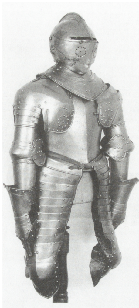
Ryc. 16. Niemiecka zbroja kirasjerska z początku XVII wieku, nr inw. MNKi/B/606