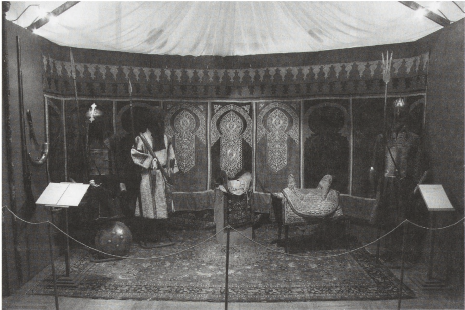
2. Fot. Ekspozycja Pasja zbierania . Kolekcja Ryszarda Janiaka