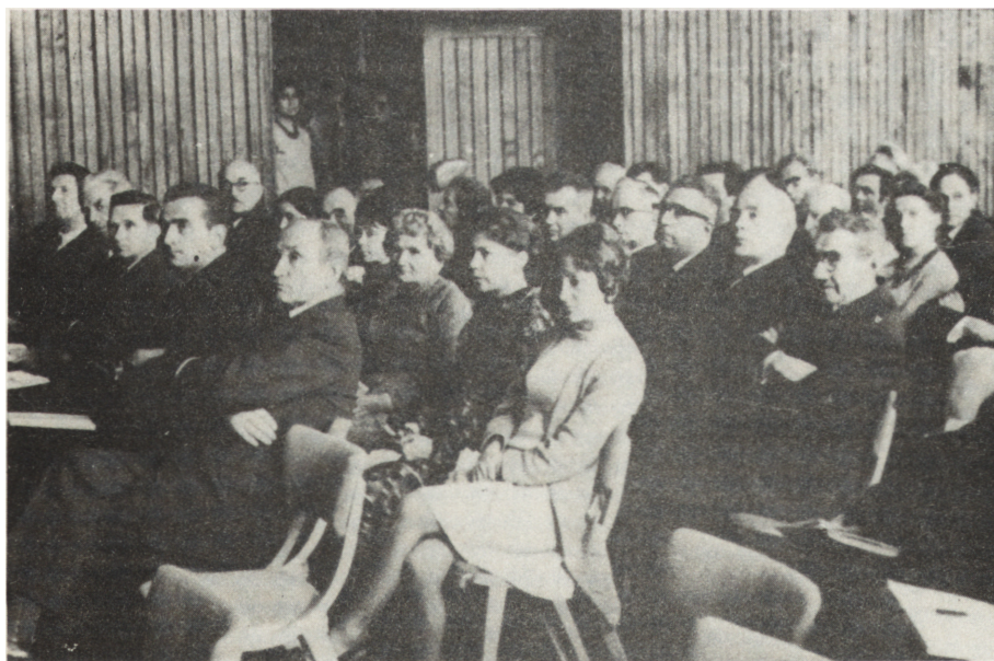
Sesja naukowa Towarzystwa w Domu Nauczyciela w Piotrkowie Tryb.