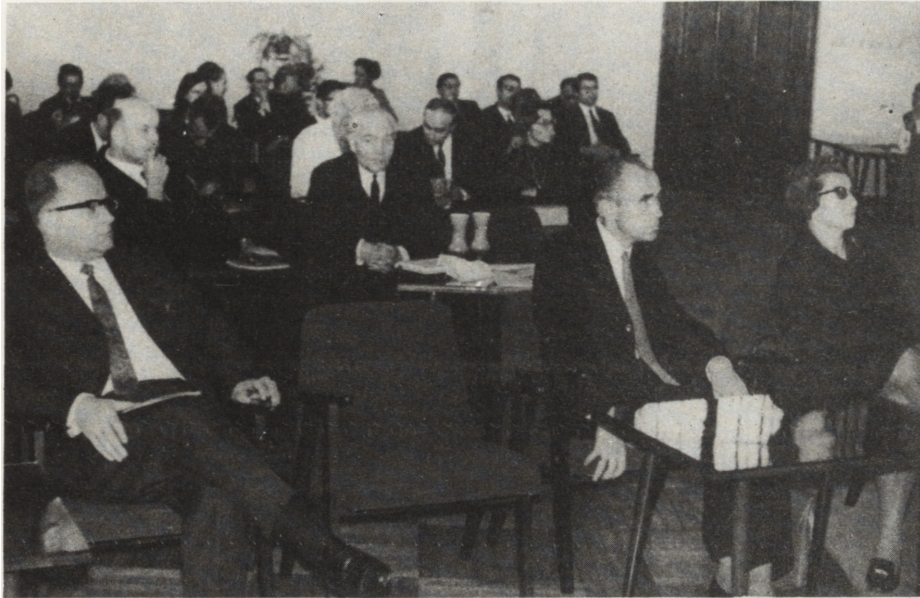
Zebranie organizacyjne Towarzystwa w gmachu Biblioteki Miejskiej w Piotrkowie Tryb.