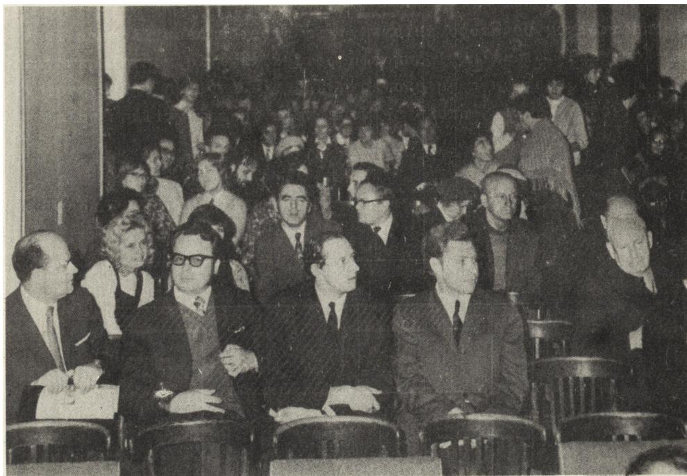
Widok na salę obrad w czasie sesji naukowej na Zjeździe w Lublinie