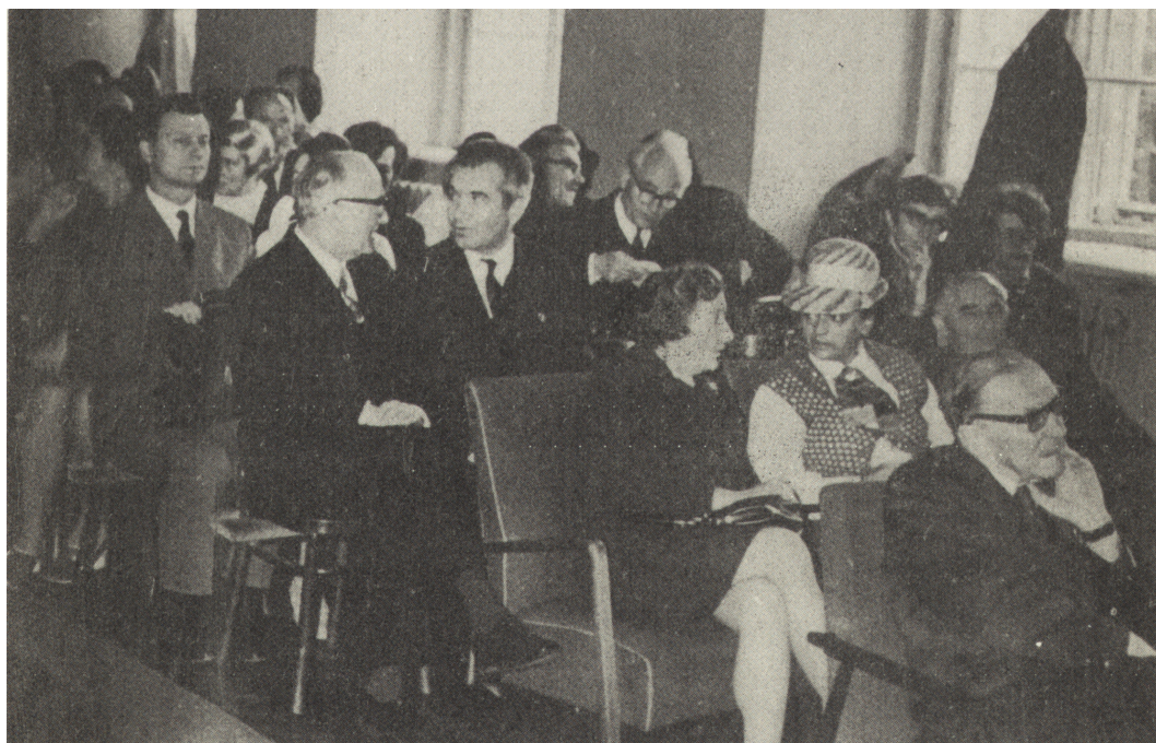
Fragment sali obrad podczas sesji naukowej na Zjeździe w Lublinie