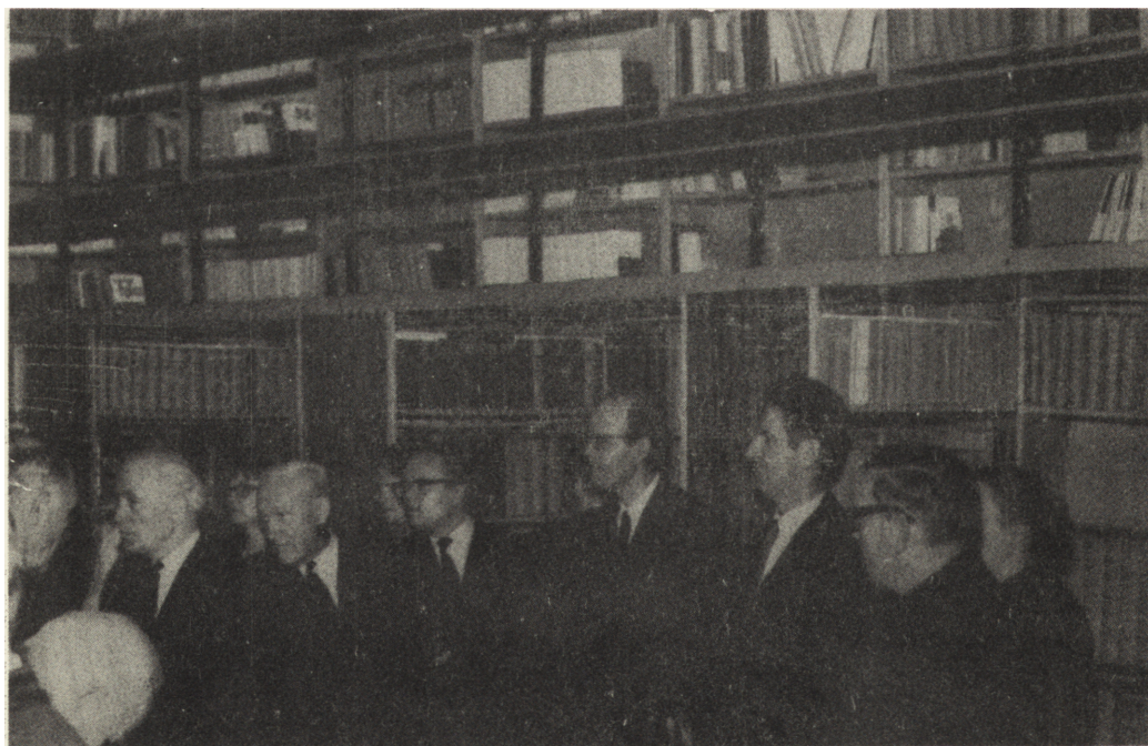
Uczestnicy Zjazdu zwiedzają Bibliotekę KUL w Lublinie