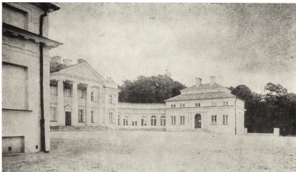
Pałac w Śmiełowie — Muzeum Adama Mickiewicza