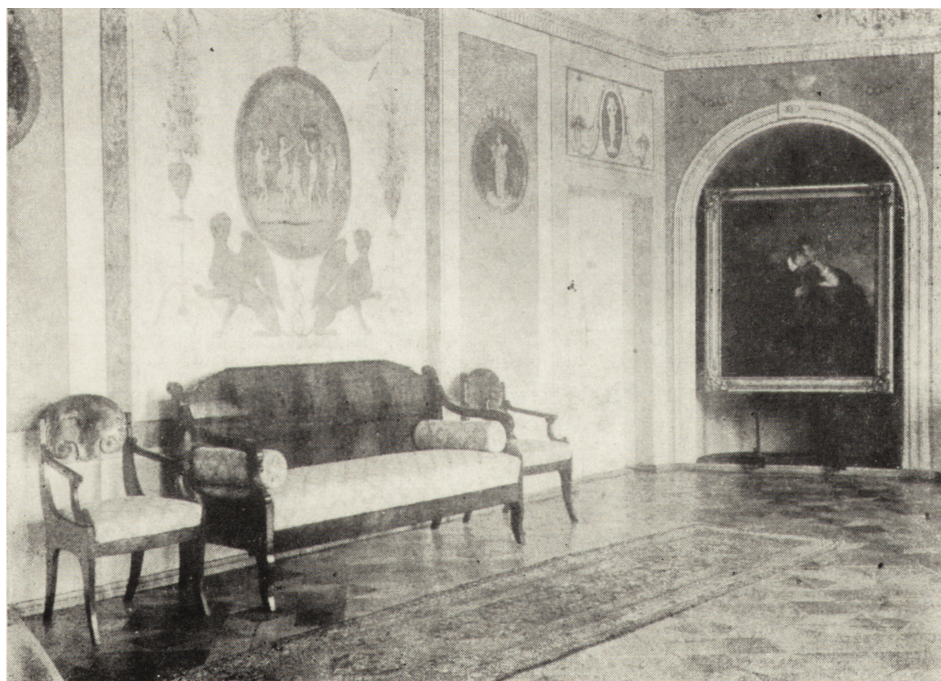
Muzeum Adama Mickiewicza w Śmiełowie. Salon zielony z freskami Szmuglewi- czów i kopią obrazu W. Wańkowicza Mickiewicz na Judahu skale