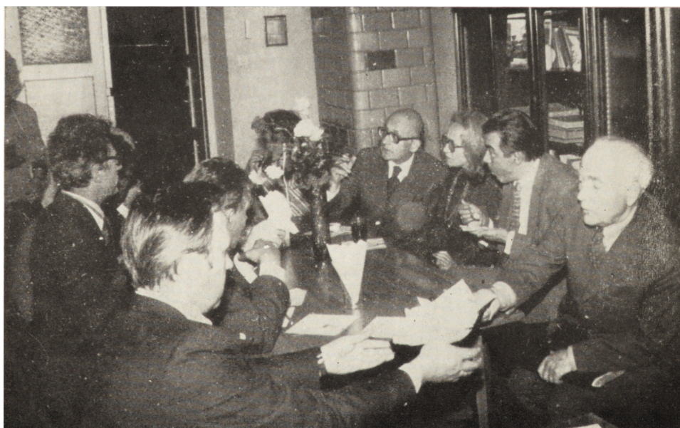
Zjazd Delegatów w Łomży. Sesja naukowa, w czasie przerwy w obradach