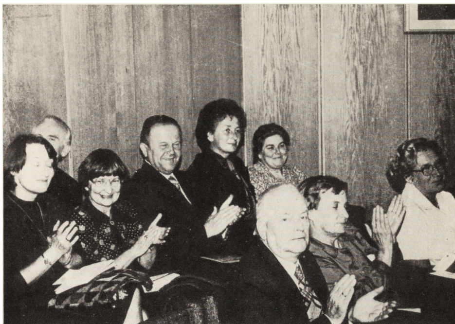
Zjazd Delegatów w Łomży. Sesja naukowa, fragment sali obrad