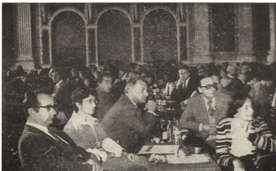
Zjazd Delegatów w Łomży. Sesja naukowa pt. „Recepcja twórczości J. Słowackiego”. Widok na salę obrad