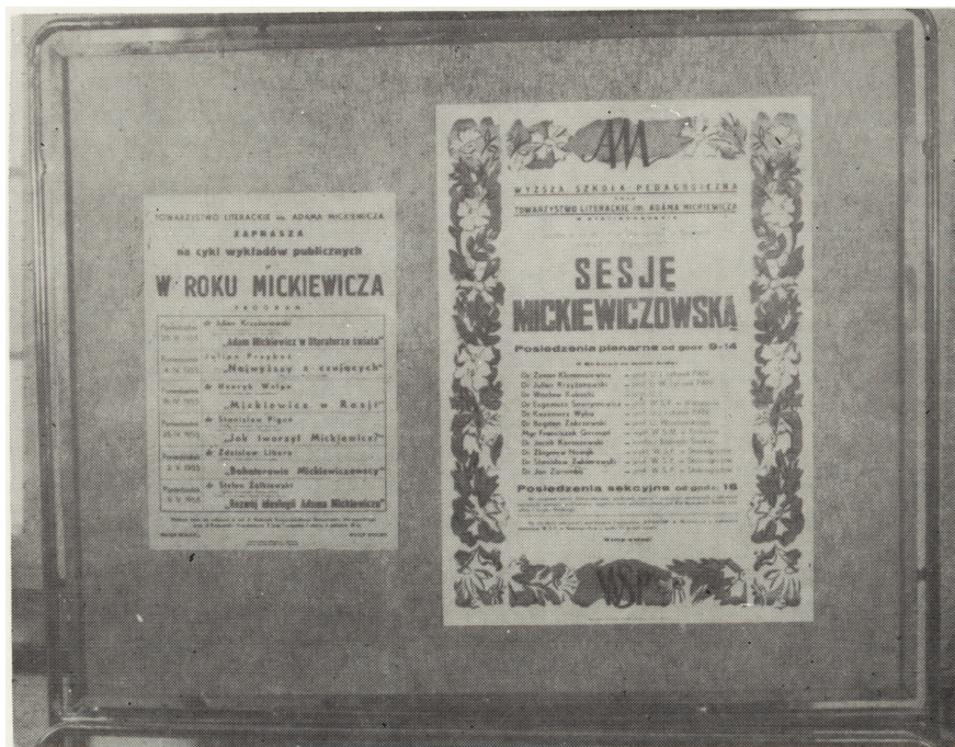
Wystawa Jubileuszowa w Warszawie. Plakaty Sesji Mickiewiczowskich z 1955 r. w Warszawie i Katowicach