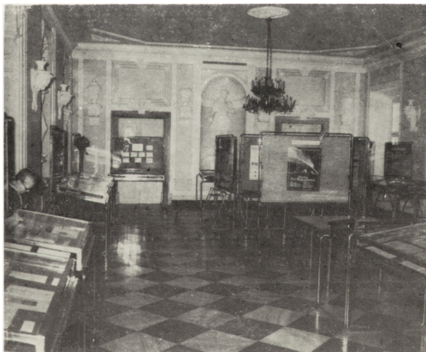
Wystawa Jubileuszowa w Pałacu Rzeczypospolitej w Warszawie. Plansza poświęcona założycielom Towarzystwa. Widok ogólny sali