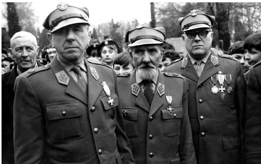
Weterani powstań śląskich uczestniczący w Wieluniu w obchodach 50. rocznicy wybuchu III powstania śląskiego ( 25 IV 1971 r.).