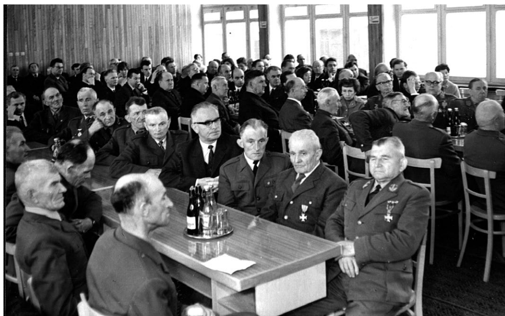
Uczestnicy sesji naukowej w Wieluniu w 50. rocznicę wybuchu III powstania śląskiego (25 IV 1971 r.).