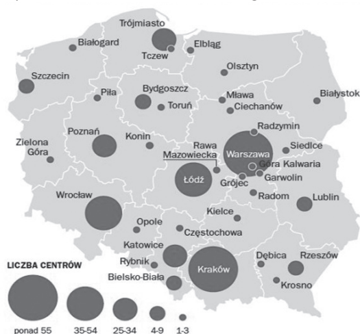
Wykres 2. Rozmieszczenie centrów usług w Polsce w 2011 roku