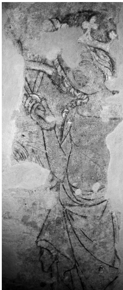
Św. Katarzyna Aleksandryjska

W ramach prac remontowych prowadzonych na pierwszym piętrze wschodniego skrzydła klasztoru odkryto w dniu 22 lutego 2011 roku XIV-wieczną polichromię przedstawiającą m.in. św. Katarzynę Aleksandryjską. Badania i konserwacja przeprowadzona przez zespół konserwatorski prof. Ewy Roznerskiej-Świerczewskiej z UMK w Toruniu potwierdziły wysoką wartość zabytkową odkrycia oraz postawiły pod znakiem zapytania powszechnie przyjmowane w literaturze przeznaczenie pomieszczeń tej części klasztoru.