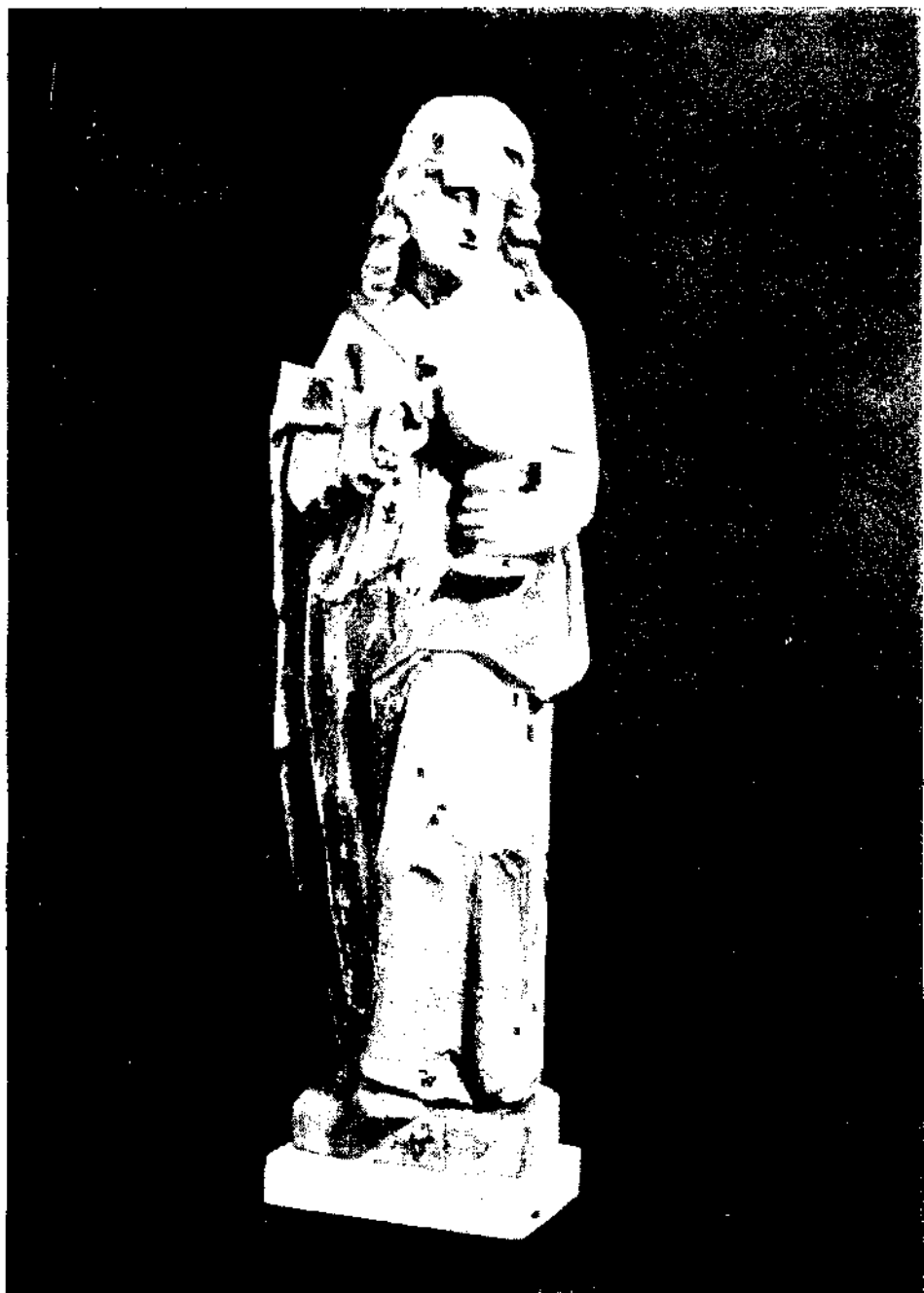
Św. Jan Ewangelista rzeźba w kościele gierałtowickim z drugiej połowy XVI w.