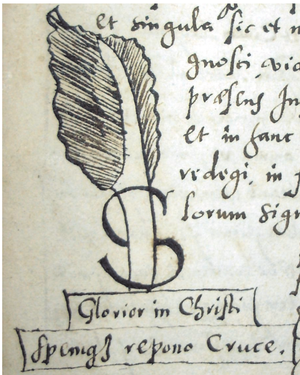
Фігура 3. Нотаріальний знак Станіслава Ансеріна, 1571 р. (ЦДІАУЛ, ф. 138, оп. 1, спр. 338, с. 6)