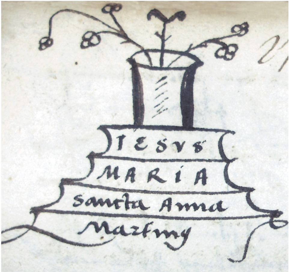
Фігура 2. Нотаріальний знак Мартина з Велички, 1522 р. (ЦДІАУЛ, ф. 52, оп. 2, спр. 232, с. 272)