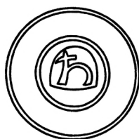
Мал. 10. Печатка пана Мишка Вигайловича 1510 р.