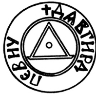
Мал. 4. Печатка пана Довгирда 1434 р.