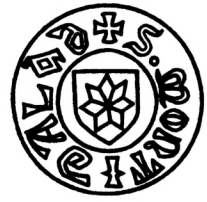
Мал. 3. Печатка пана Монтигайла Урдовича 1434 р.