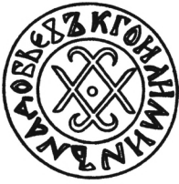
Мал. 1. Печатка пана Голіміна Надобовича 1434 р.