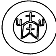
Мал. 2. Печатка пана Монтрима 1434 р.