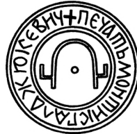
Мал. 5. Печатка пана Монтигайла Жукевича 1434 р.