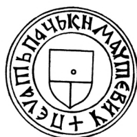
Мал. 11. Печатка пана Івашка Довойновича 1434 р.