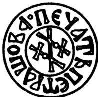
Мал. 6. Печатка пана Петраша 1434 р.