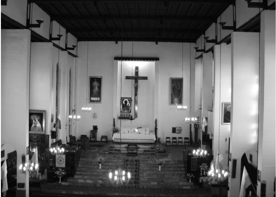
Wnętrze kaplicy pw. św. Brunona w Giżycku dzisiaj

Dziś obraz św. Brunona zawieszony jest po prawej stronie ściany ołtarzowej, na wysokości ok. 2 metrów. Samo płótno ma wymiary 300 cm x 150 cm, wykonano go techniką olejną 3 . Obecnie obramowane jest złotą ramą – co sprawia, że odcina się na tle białej ściany i jest widoczny z każdego miejsca w kościele 4 . W lewym dolnym rogu widnieje podpis autora – Julian Wałdowski, oraz data, w którym powstało płótno – 1912 r.