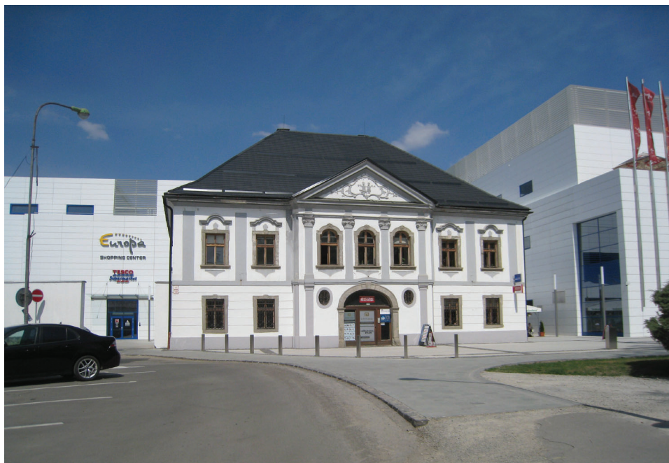
Fot. 5. Finkova kúria a Európa Shopping and Relax Center