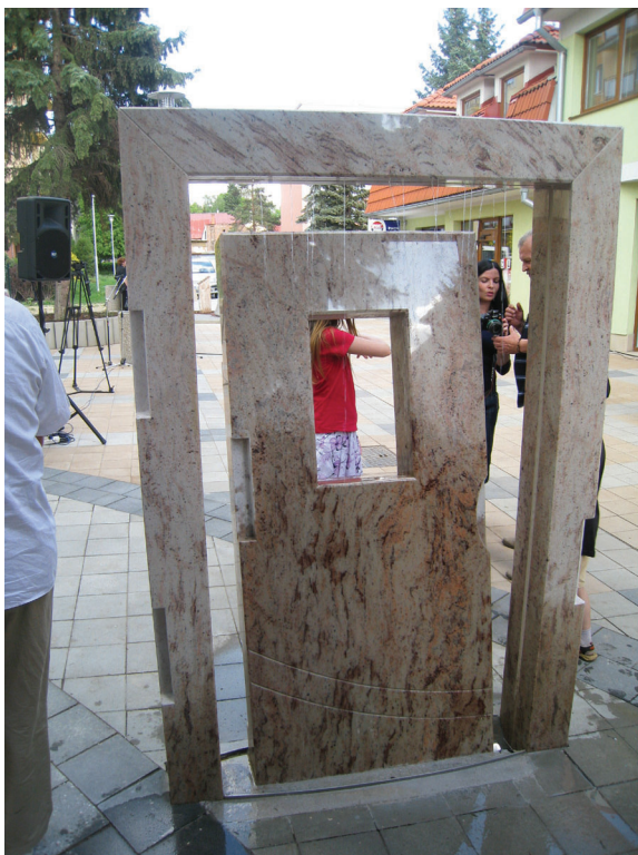
Fot. 4. Plačúca fontána (fot. K. Košťalová, 2009)

Základnou kostrou globalizácie je ekonomická globalizácia, ktorá so sebou prináša etablovanie nadnárodných obchodných a reštauračných sietí, nákupných komplexov i ponúk na prilákanie investícií medzinárodných spoločností. V ostatných rokoch dochádza vo Zvolene najmä k budovaniu nákupných komplexov (Retail Park, Európa Shopping and Relax Center...) a ich zasadenie do urbánneho priestoru mení vzhľad mesta a v niektorých prípadoch narúša i pamiatkovú, historickú zónu mesta. Stavbou, ktorá výrazným spôsobom zmenila urbanizmus severnej časti historického jadra Zvolena je Európa Shopping and Relax Center 21 . Situovaná je v blízkosti národnej kultúrnej pamiatky – Finkova kúria 22 a z opačnej strany v blízkosti hradieb mestského opevnenia. Výstavbou Európy (ako ju Zvolenčania nazývajú) sa priestor okolo kúrie a hradieb zmenil a globalizačné prvky a symboly tieto pamiatky prekryli (pohltili).