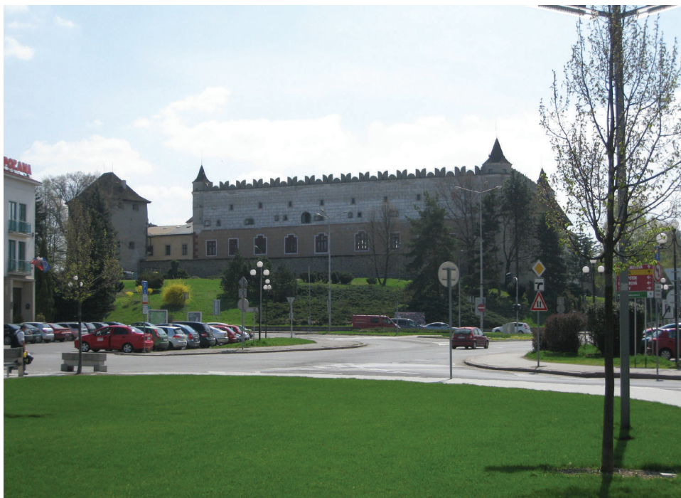
Fot. 1. Zvolenský zámok

Reprezentačné priestory zámku slúžia celoročne na kultúrno-spoločenské účely a sú dejiskom koncertov rôznych hudobných žánrov, výstav, divadelných predstavení a zábavných podujatí pre verejnosť. K najnavštevovanejším patria Zámocké hry zvolenské (ZHZ). ZHZ sú najstarším plenérovým profesionálnym divadelným festivalom na Slovensku, ktorý sa v tomto roku (2013) bude konať už štyridsiatykrát. Od roku 1993 sú na ZHZ prizývané i zahraničné divadlá a sólisti, čím festival získal podtitul „Medzinárodný letný divadelný festival“. Okrem ZHZ sa na zámku konajú aj Letné shakespearovské slávnosti 14 . Myšlienka festivalu vznikla v Českej republike. Slovenská história slávností sa začala písať v roku 2001, keď sa podujatie konalo na Bratislavskom hrade. V roku 2009 na festivalovej mape pribudol aj Zvolen a Zvolenský zámok, ktorý každoročne prepožičiava svoje nádvorie niektorej zo Shakespearových hier. Moderné spracovanie diel anglického dramatika v podaní slovenských i českých hercov, kedy sa prirodzene prelína slovenčina s češtinou, sa stretáva s veľkým ohlasom u návštevníkov podujatia. Priestory zámku sa tiež využívajú na organizovanie plesov, kongresov i na občianske obrady (svadby, uvítanie do života). V kaplnke Zvolenského zámku sa pravidelne konajú rímskokatolícke, gréckokatolícke a pravoslávne bohoslužby a sobáše.