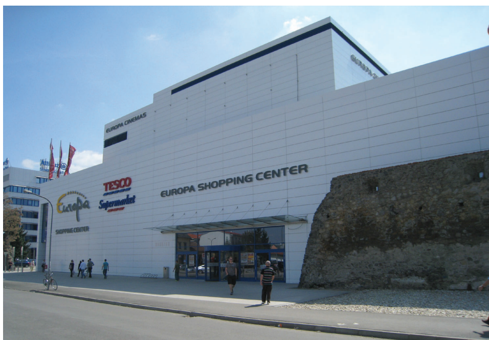
Fot. 6. Hradby mestského opevnenia a Európa Shopping and Relax Center