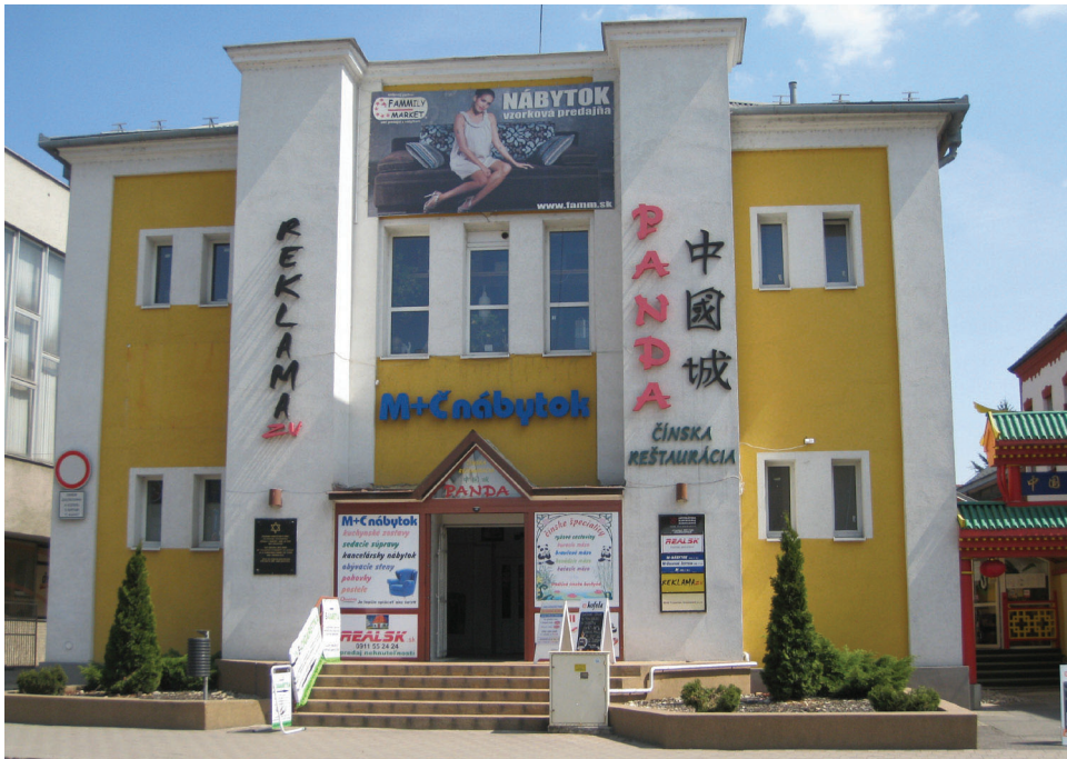
Fot. 2. Bývalá židovská synagóga

V priebehu rokov sa niektoré kultúrne pamiatky z urbánneho priestoru úplne vytratilí a zanikli, iné stratili svoju pôvodnú funkciu. Príkladom stopercentnej zmeny funkcie je židovská synagóga, ktorá bola v 50. rokoch 20. storočia prestavaná na sklad liečiv a v súčasnosti je využívaná na obchodné a reštauračné účely 19 . V priestoroch bývalej synagógy je obchod s nábytkom, s lacným textilom (takzvaný čínsky) a čínska reštaurácia Panda. Prelínanie rôznorodých, i nevhodných symbolov na budove potláča pamätnú tabuľu umiestnenú na priečelí. Tabuľa obsahuje text: Židovská náboženská obec vo Zvolene túto budovu užívala v rokoch 1896 až 1950 ako synagógu. I napriek tomu, že sa bývalá synagóga nachádza v širšom jadre mesta, mladí ľudia nemajú vedomosti o jej pôvodnej funkcii. Vnímajú ju ako budovu, kde sa nachádza čínska reštaurácia.