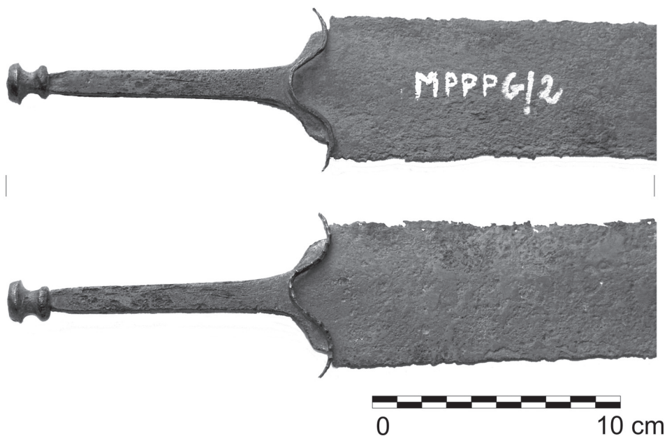
Fot. 2. Rękojeść miecza z okolic Bydgoszczy