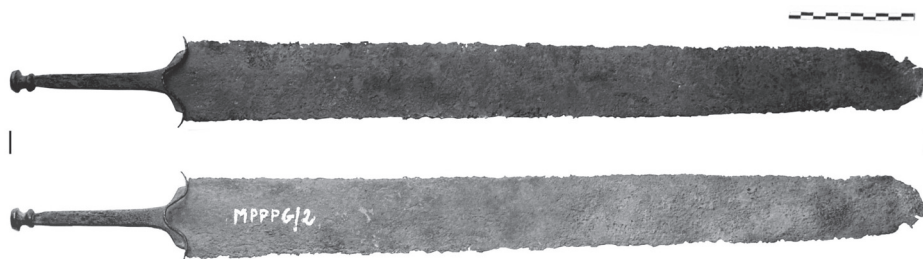
Fot. 1. Miecz z okolic Bydgoszczy