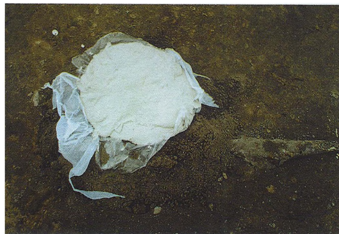
Ryc. 6. Misa brązowa wypełniona gipsem przed wyjęciem z grobu