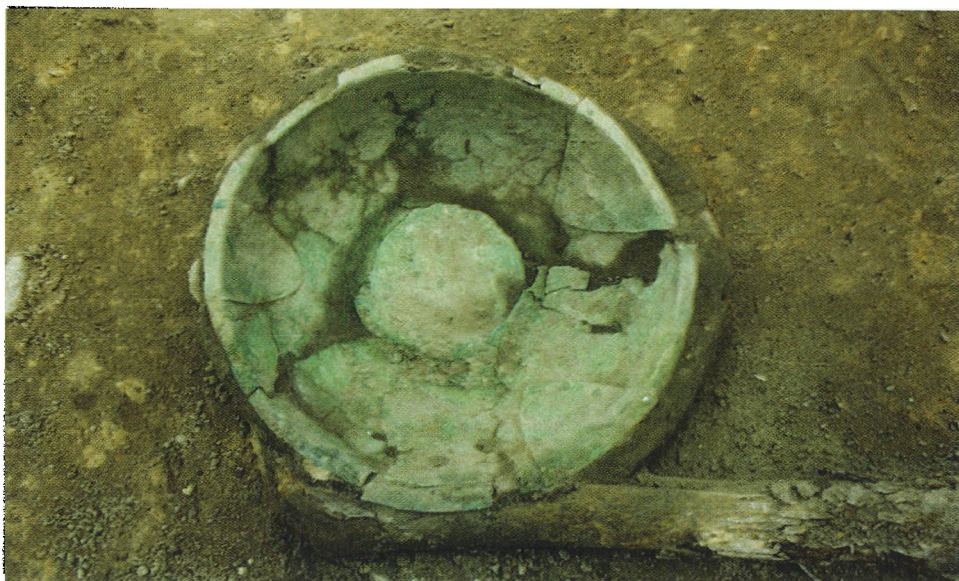
Ryc. 2. Misa brązowa in situ w grobie