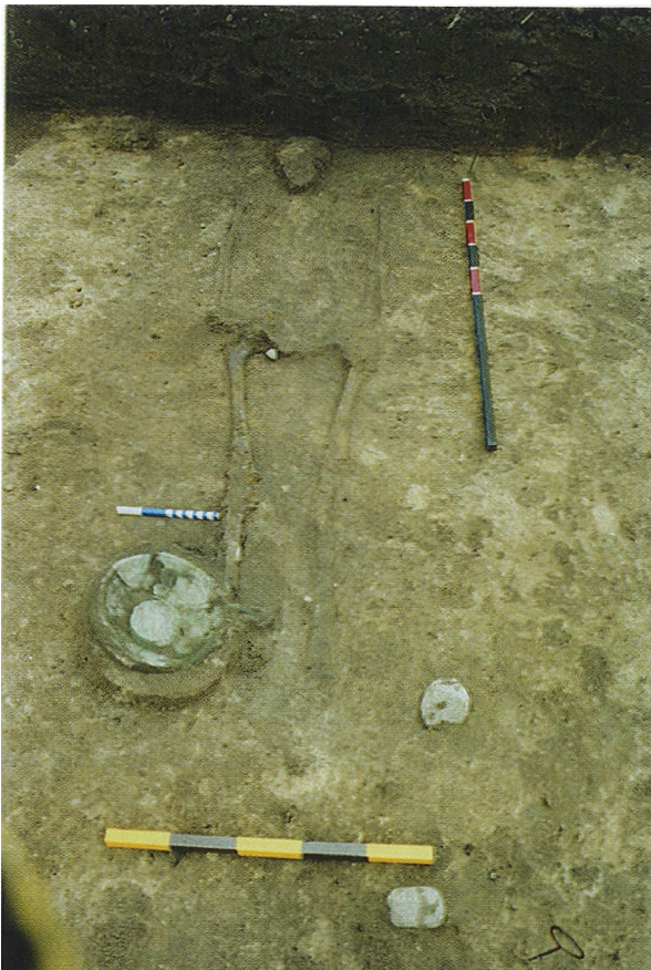
Ryc. 1. Grób 17/98 — widok od zachodu