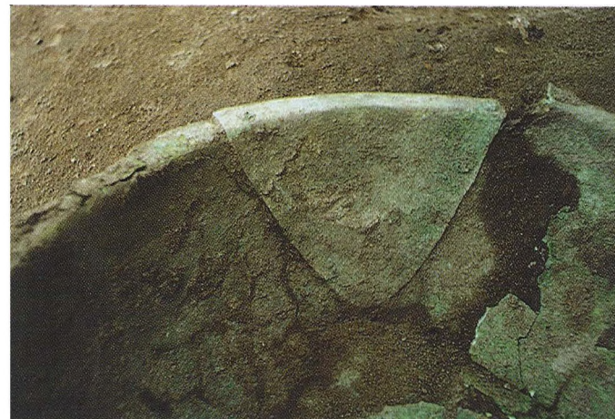
Ryc. 4. Misa brązowa in situ w grobie — fragment