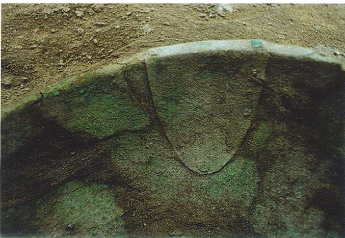
Ryc. 5. Misa brązowa in situ w grobie — fragment