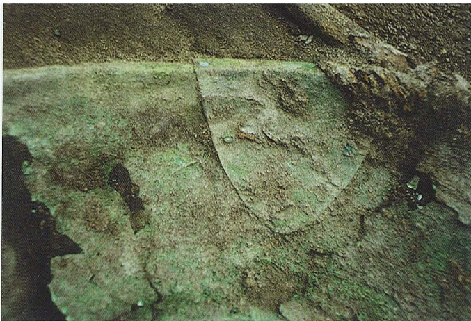
Ryc. 3. Misa brązowa in situ w grobie — fragment