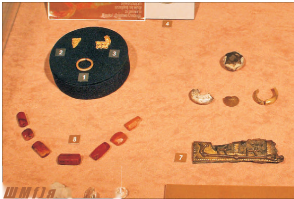
Fot. 7. Wydzielone do jednej z gablot zabytki luksusowe jeszcze dzisiaj robią wrażenie

The display-boards part of the exhibition (in the foreground: a model of the single-nave church with its picture.