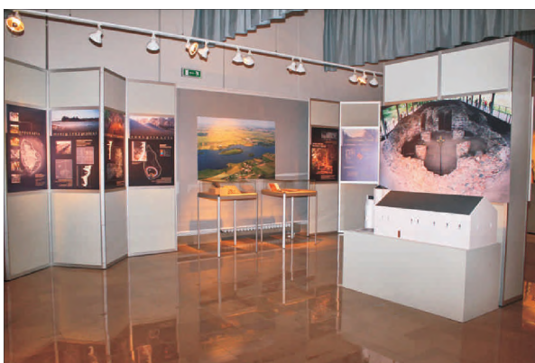
Fot.4. Istotny element narracji ekspozycyjnej stanowiły liczne zdjęciowo-tekstowe plansze oraz modele kamiennej architektury Ostrowa Lednickiego - tutaj widoczny model książęcego palatium

A part of the exhibition consisting of mannequins - the component of the exposition arrangement.