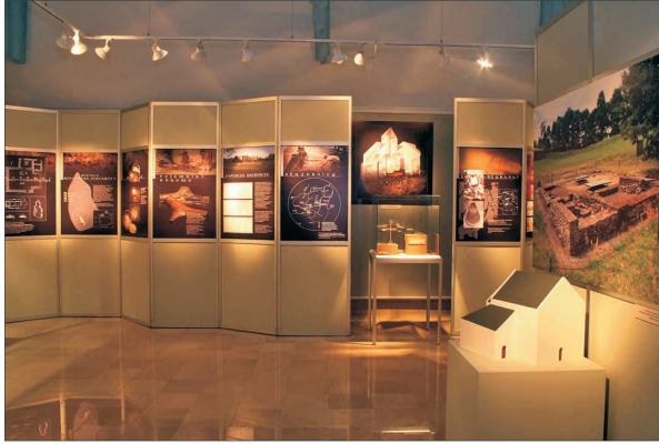
Fot. 6. Część planszowa wystawy (na pierwszym planie model jednonawowego kościoła z jego zdjęciem

The display-boards part of the exhibition (in the foreground: a model of the single-nave church with its picture.