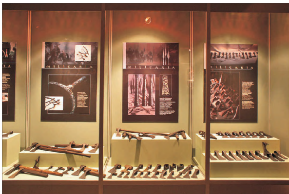
Fot. 8. W jednej z wieloprzestrzennych gablot zgromadzono pochodzące z Ostrowa Lednickiego uzbrojenie - tutaj widoczny fragment kolekcji broni obuchowej

Luxury artifacts, selected in a display case, are still impressive.