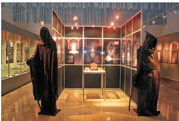
Fot.5. W odrębnym bloku ekspozycyjnym znalazły się pochodzące z wyspy przedmioty chrześcijańskiego kultu

Many display-boards with texts and photographs as well as the models of the Lednica Holm stone architecture were a vital element of the expositional narration - in the picture: a model of the rulers' palatium.