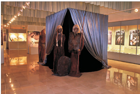
Fot.3. Fragment wystawy z postaciami manekinów stanowiącymi część jej plastycznej aranżacji.

A part of the exhibition consisting of mannequins - the component of the exposition arrangement.