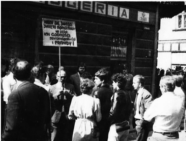
4. Próba zorganizowania manifestacji przez członków i sympatyków „Solidarności” w dniu 1 V 1983 r. w Kielcach; AIPN Ki, 025/307, k. 511