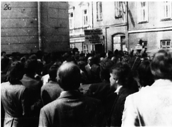
5. Próba zorganizowania manifestacji przez członków i sympatyków „Solidarności” w dniu 1 V 1983 r. w Kielcach; AIPN Ki, 025/307, k. 394

7. W omawianym okresie na terenie województwa zanotowano 3 strajki w tym strajk 13.05.1982 r. W dniach 13–14.12.1981 r. w Hucie im. M. Nowotki w Ostrowcu Świętokrzyskim aktywiści b[ý]łego] związku „Solidarność” zorganizowali strajk protestacyjny w związku z wprowadzeniem stanu wojennego w Polsce. Łącznie w strajku wzięło udział ok. 2000 osób. W wyniku realizowania działań neutralizujących: zatrzymano 16 osób, aresztowano – 7, internowano – 5. Wyrokami sądowymi skazano – 10 oraz przeprowadzono 120 rozmów ostrzegawczych pobierając przy tym oświadczenia o lojalności i przestrzeganiu obowiązującego porządku prawnego.