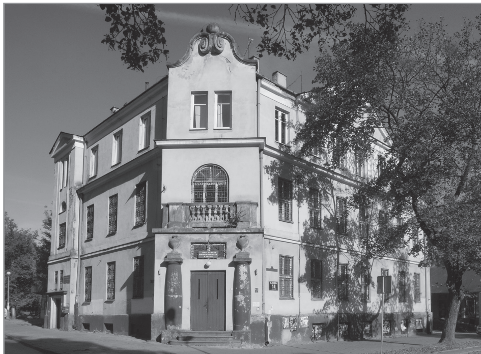
Wacław Nowakowski, Łaźnia miejska w Kielcach

Sporządzoną przez Nowakowskiego listę należy traktować jako punkt wyjścia do poszukiwań odpowiedzi na pytania, które wyłaniają się w trakcie konfrontacji z materiałami źródłowymi. Większość z wymienionych na liście obiektów wymaga dodatkowych badań, przede wszystkim w zakresie odnalezienia dokumentacji projektowej (rzuty, przekroje, rysunki elewacji), która pozwoliłaby nie tylko na pogłębioną analizę