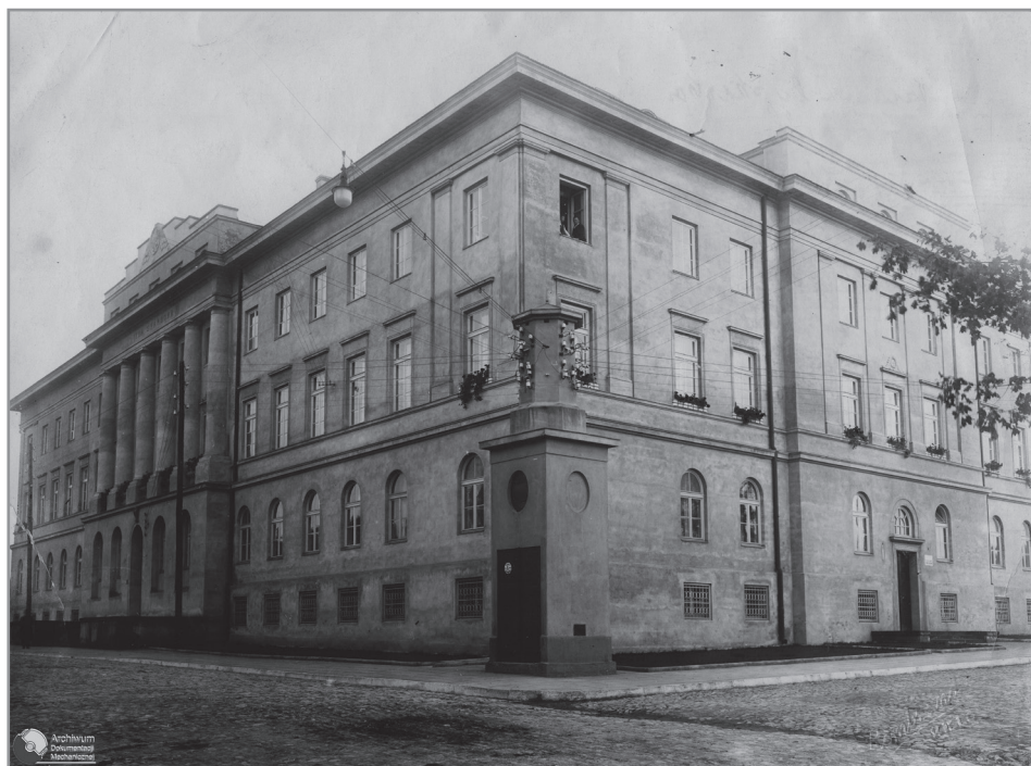
Wacław Nowakowski, Izba Skarbowa w Kielcach; Narodowe Archiwum Cyfrowe, sygn. 1-G-6282