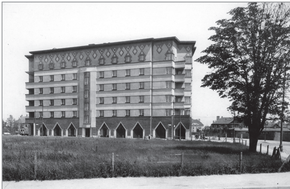
Wacław Nowakowski, kamienica Zakładu Ubezpieczeń Pracowników Umysłowych we Lwowie przy placu Inwalidów 6 w Krakowie, 1927–1929; fot. Muzeum Historyczne Miasta Krakowa, Agencja Fotograficzna „Światowida”, Fs 11930-IX