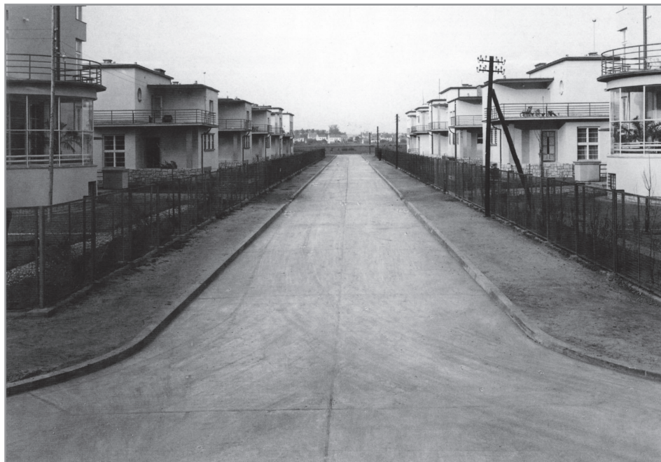
Wacław Nowakowski, Osiedle Komunalnej Kasy Oszczędności Powiatu Krakowskiego w Cichym Kąciku w Krakowie, 1937–39; MHF18856/II