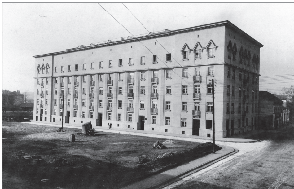
Wacław Nowakowski, kamienica Zakładu Ubezpieczeń Pracowników Umysłowych we Lwowie, przy al. Słowackiego 30–36, róg ulicy Mazowieckiej 2 w Krakowie; Muzeum Historyczne Miasta Krakowa, fot. Tadeusz Jabłoński, Fs 3-IX