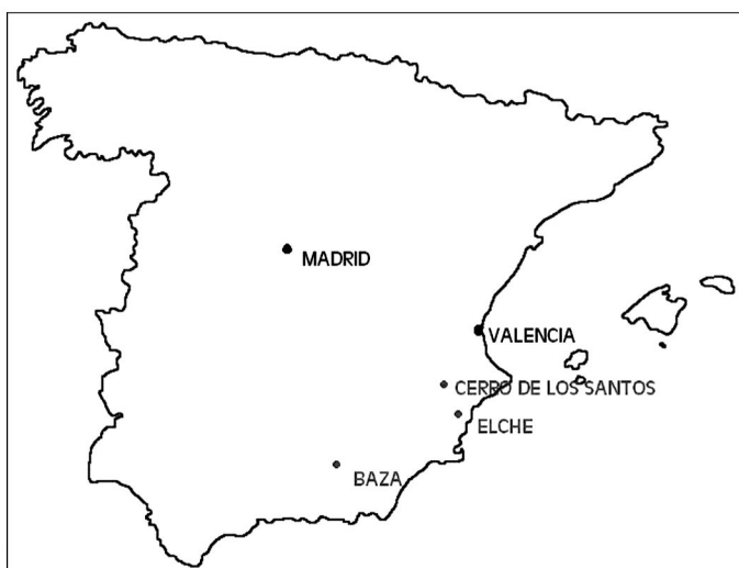
Fig. 1. Terytorium kultury iberyjskiej i stanowiska: Elche, Baza i Cerro de los Santos