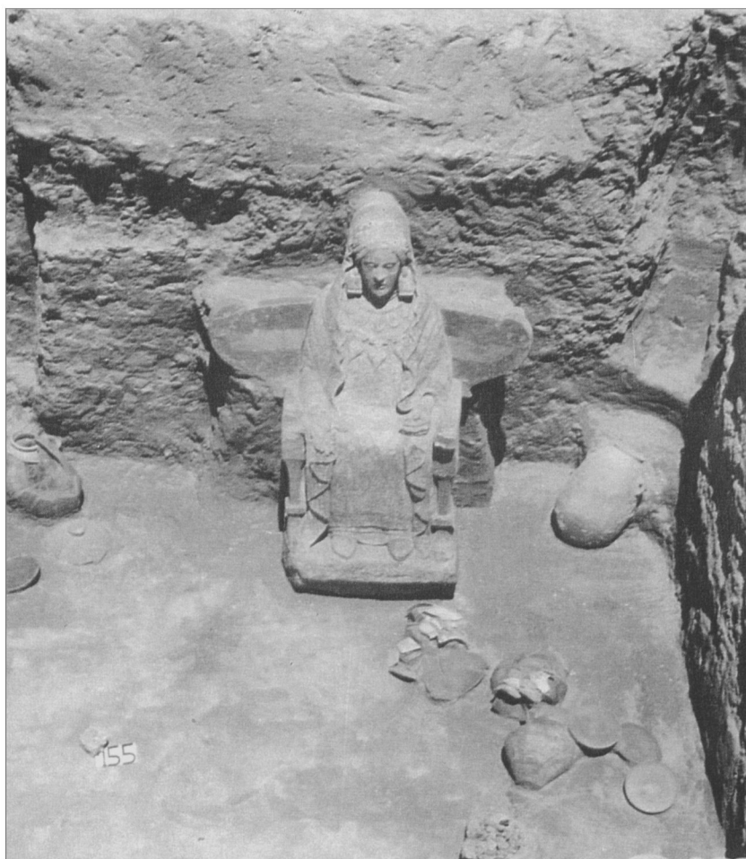
Fig. 3. Dama z Baza (MODRZEWSKA-PIANETTI 2002: Fig. I. 60)