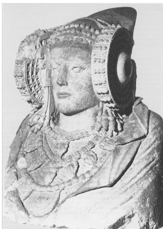
Fig. 2. Dama z Elche (MODRZEWSKA- PIANETTI 2002: Fig. I. 73)