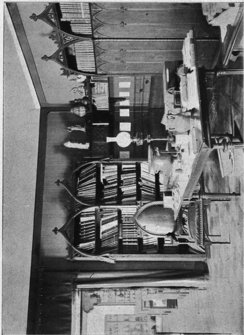
Zbiór przedhistoryczny E. Majewskiego.