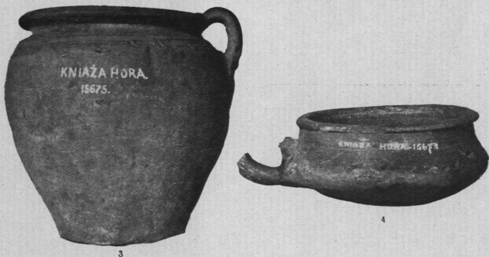
Fig. 3 — 4.

glinki z wsi Leplowa; były w niem 2 gliniane przęślice i guz srebrny od czamary, filigranowy; dar K. Bołsunowskiego". Pod Nr. zaś 18819 zaznaczono: „guz z srebra od ubioru polskiego, był w naczyniu Nr. 18818." Amforka jest najzupełniej tej samej formy, co amforka z Zariczja i jest identycznie wykonana. Posiada ona zupełnie płaskie dno, ściany równomiernie rozszerzają się ku środkowi naczynia i następnie zwężają się ku nasadzie wąskiej szyjki (5.6 cm. w średn.); szyjka rozchyła się lejkowato ku ukośnie ściętej krawędzi (6.4 cm. w średn). Wysokość amforki wynosi 16 cm, grubość ścian 0.7 cm.