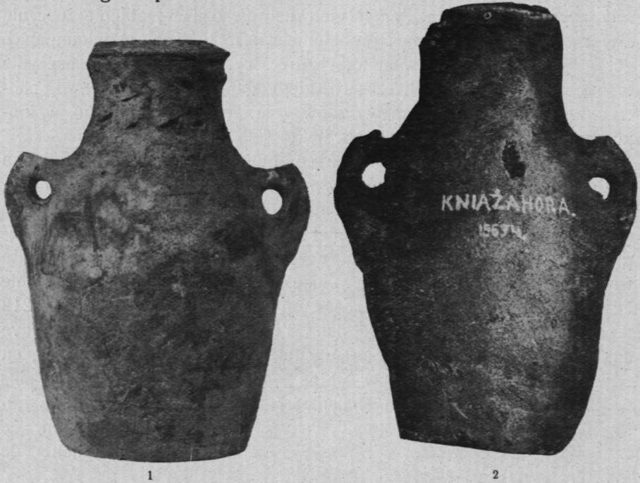
Fig. 1. Amfórka z Zariczja; Fig. 2. Amfórka z Kniażej Hory; ok. \frac{1}{2} w. n.). (Petites amphores de Zaritchie et de Kniaża Hora en Ukraïne; ca \frac{1}{2} gr. n.).

transversal?) en cuivre pur, une hache plate, 1000 anneaux de bronze différents faits d'un étroit ruban plat, 4 cônes en plaques de bronze et une boucle en bronze. La trouvaille a été faite en 1885 dans un champ. Bien des objets de cette importante découverte ont probablement été égarés par le musée“.