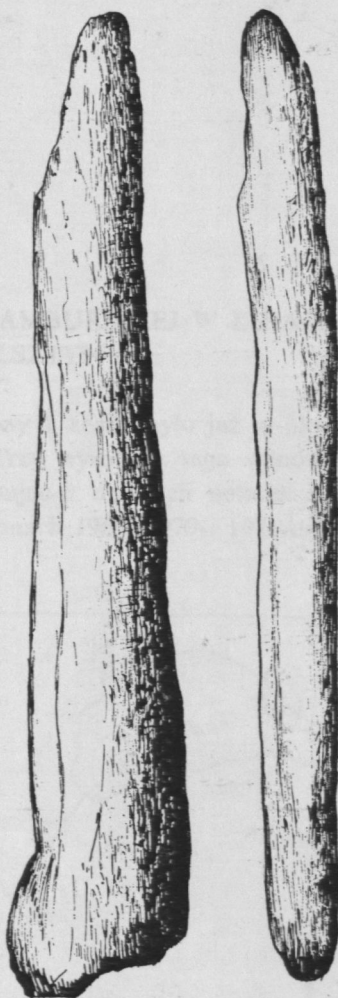
Fig. 1. Jaskinia Mamutowa. Zabytek kościany w.n.

kości (4 sztuki). Na uwagę zasługuje fragment kości (najpewniej renifera ?) noszący zapewne ślady wygładzenia (fig. 1 — por. oznaczenie na rysunku). Wymienić także wypada fragment siekacza mamuciego bez śladów obróbki. Ponadto wystąpiły dwie drzazgi kostne.