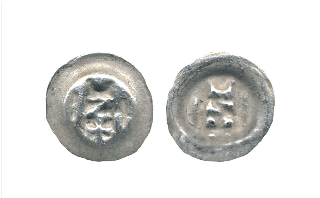
Fig. 1. Brakteat z przedstawieniem dwóch słupów, pomiędzy nimi symbol w kształcie litery Z, powyżej – kulka, poniżej – krzyż, Waschinski 198, 0,14 g, 12,4 mm