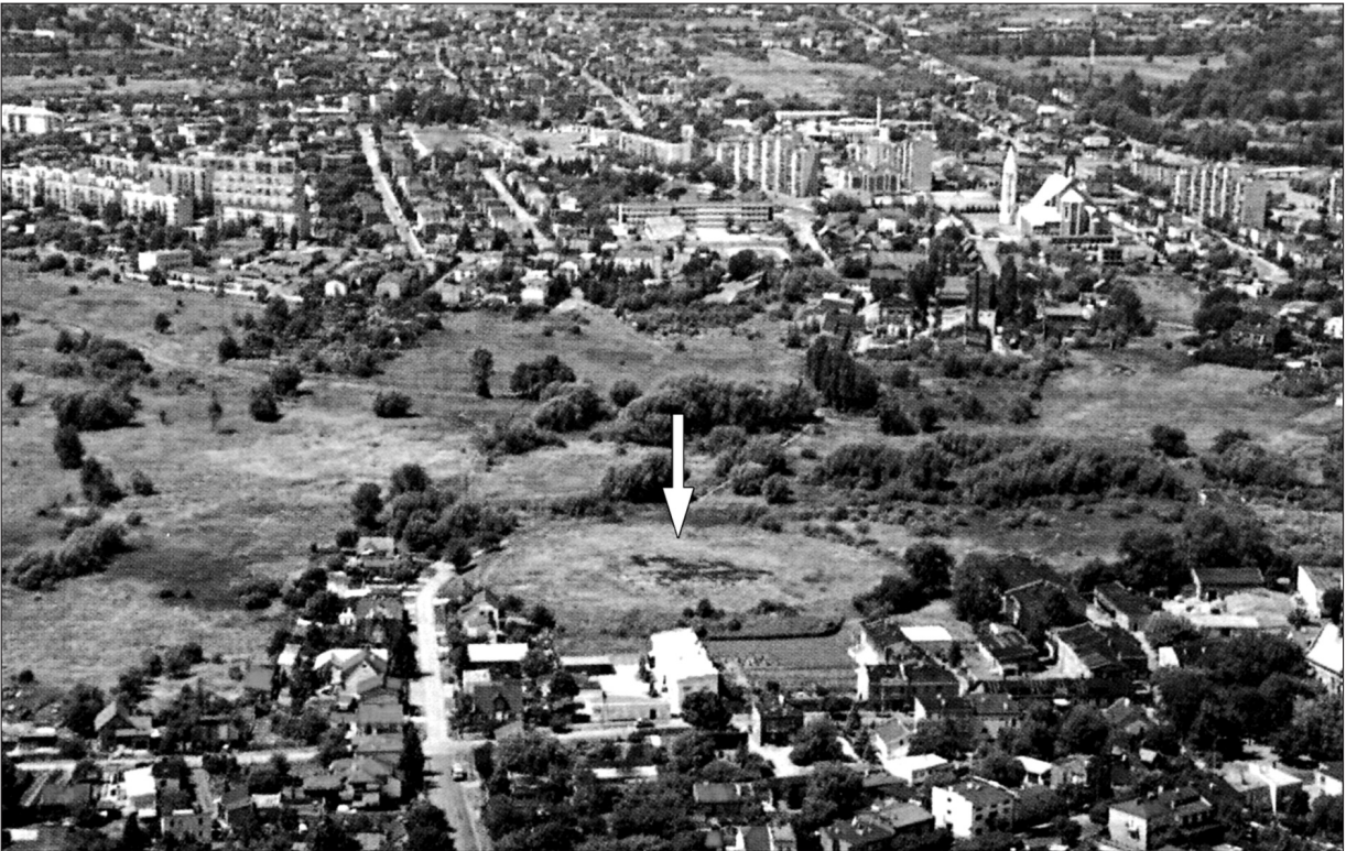
Ryc. 1. Radom. Widok na dolinę rzeki Mlecznej i grodzisko „Piotrówka”.

Fig. 1. Radom. View towards the valley of the River Mleczna and the “Piotrówka” stronghold.