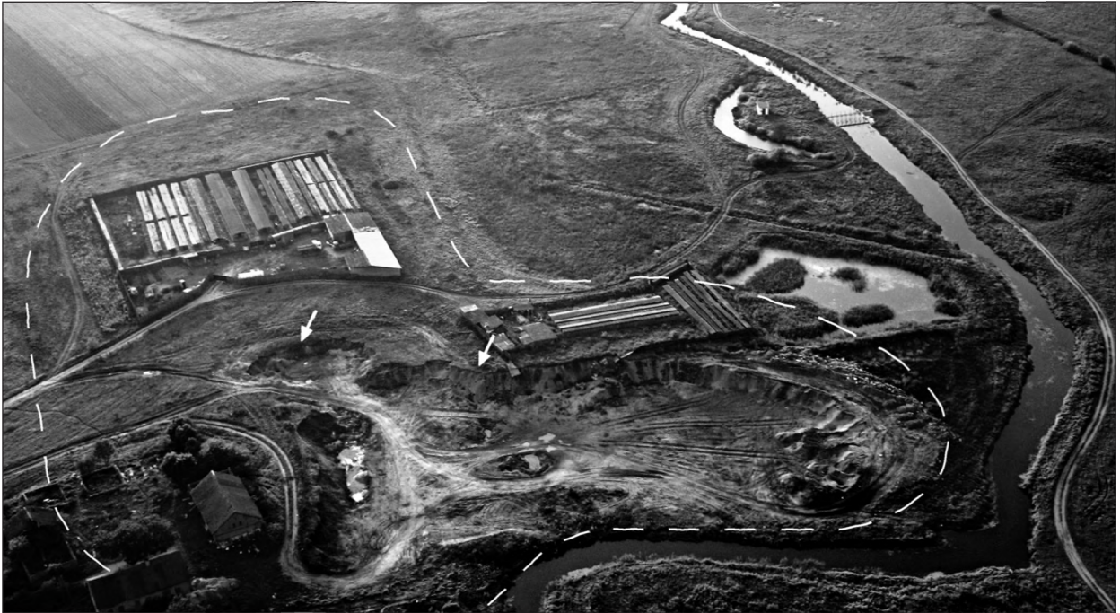
Ryc. 1. Kośmidry. Widok na stanowisko I od południowego wschodu. Obrysem zaznaczono przybliżony zasięg osady (wzgórza), strzałkami – lokalizację wyeksplorowanych obiektów (oprac. P. Szymański).