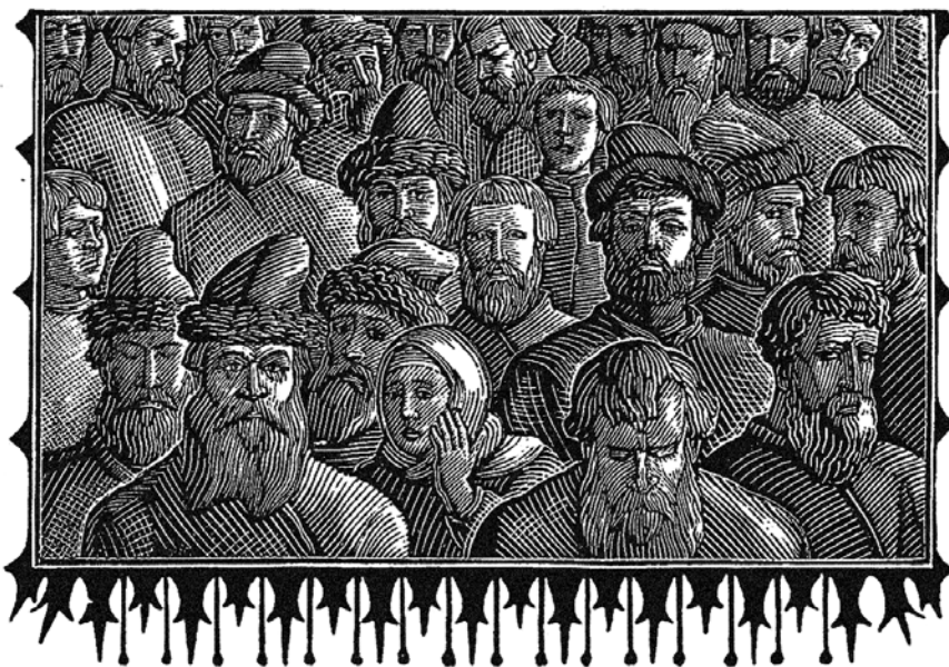
Илл. 7. В. Фаворский, Народ безмолвствует , 1956, гравюра на дереве

был против того, чтобы про него писали, что если он человек хороший, то и искусство у него хорошее. Важнее для него были честность и вера. Но невольно прислушивался к тому, что говорилось, о хороших, с его точки зрения, идеях. Так, в какой-то момент Фаворский подумал, что можно придать настоящую образную форму идее Дворца Советов или решил, что неслучайно после войны все захотели психологических образных эффектов и пробовал забыть о вечном начале в Борисе Годунове (илл. 7). Но в последней своей работе Маленькие трагедии понял, что ошибался, вернувшись к более ранним тенденциям „образ-вещь”, где была важна не условность искусства, а обусловленность определенными обстоятельствами.