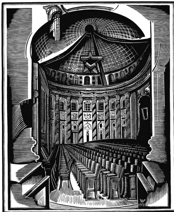
Илл. 6. В. Фаворский, Кремль, Свердловский зал, 1921, гравюра на дереве