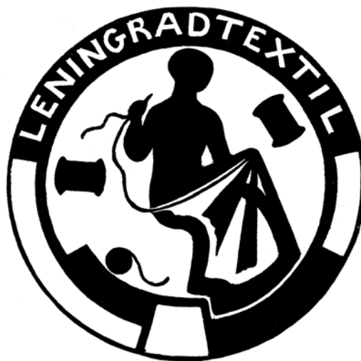
Илл. 4. В. Фаворский, этикетка для катушки ниток, 1920-е, гравюра на дереве