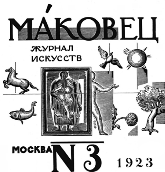
Илл. 1. В. Фаворский, „Маковец”, обложка журнала, 1923, гравюра на дереве

Для Фаворского формальный метод в искусстве стал определяющим на всю жизнь. С этими взглядами он приходит в 1921 г. работать в Высшие художественно – технические мастерские (Вхутемас), а с 1923 по 1926 г.г., т.е. в лучшие для вуза годы, он – ректор этого легендарного учебного заведения. Именно при ректорстве Фаворского были созданы новаторские учебные