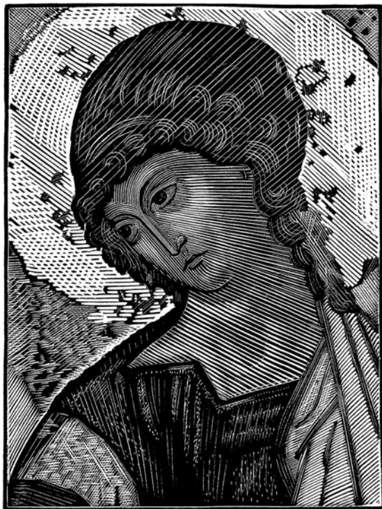
Илл. 2. В. Фаворский, Ангел (из Троицы А. Рублева), 1950, гравюра на дереве

жизни, в которой преобладает вечное, но нет образного начала.