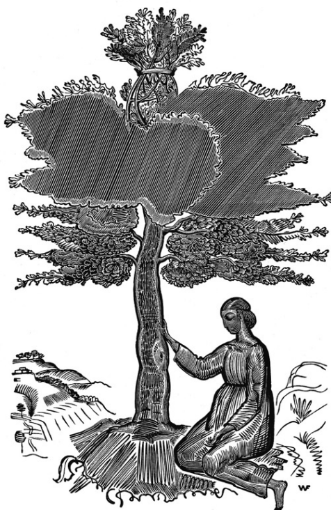
Илл. 3. В. Фаворский, Руфь под деревом , 1924, гравюра на дереве

Фаворский начал читать во Вхутемасе самый сложный курс по теории композиции, где история искусства существует как единое пространственно-временное поле культуры. И это чувство непрерывности развития культуры было тем запасом прочности, которое защищало в дальнейшие годы преследований. Приведем известные слова Манделштама о том, что вспо-