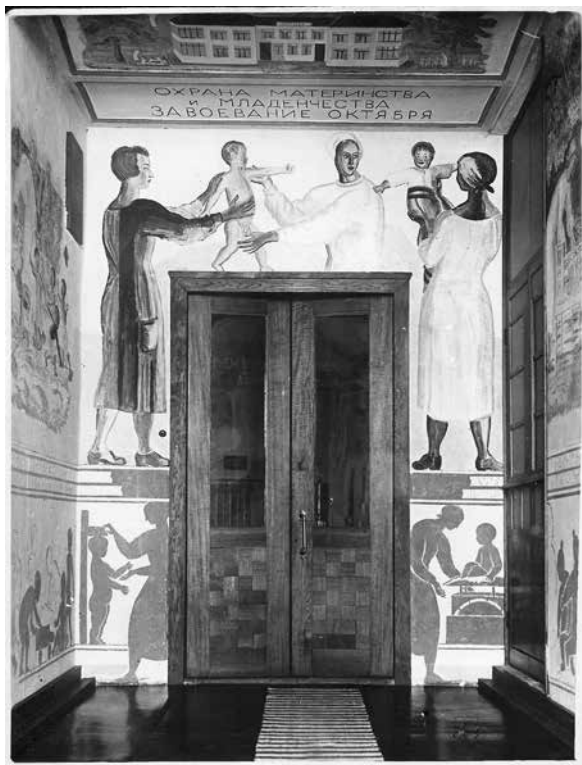
Илл. 5. В. Фаворский, вестибюль Музея охраны материнства и младенчества, 1932–33, фреска

Как сын народника с интересом Фаворский относился к мнению простых людей об искусстве. Так, в издательстве детской литературы редакторы с удивлением наблюдали, что он обратил внимание на замечания уборщицы относительно его иллюстраций и слушал ее более внимательно, чем официозного главного худож-