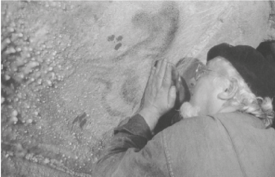
Ilustracja 3 Michel Lorblanchet