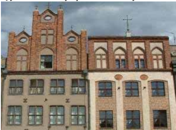
Fot. 29. Kamienice nr 50 i 51

lokacyjnego, a mianowicie Starego Rynku. Miejsce to jest uwzględnione na trasie ze względu na jego lokacyjne proweniencje i relikty gotyckie zachowane w podziemiach kamienic. Zwracają uwagę kamienice o numerach 50 i 51 (pierwsza to tzw. kamienica pod Daszkiem, druga jest siedzibą Domu Polonii), jedyne na Rynku zwieńczone zrekonstruowanymi gotyckimi szczytami. W Ratuszu – perle architektury renesansu – zachowały się elementy pierwotnej bryły gotyckiej (XIII w.) sprzed przebudowy przez Jana Baptystę di Quadro (XVI w.), są nimi podziemia oraz fragment wieży . Będąc na Rynku nie można zapomnieć o istniejącej do końca XVIII wieku na terenie obecnego Placu Kolegiackiego – dawnej gotyckiej kolegiaty św. Marii Magdaleny . Była budowlą niezwykle okazałą, trójnawową, bazylikową. Wielkością mogła konkurować z katedrą. Wieża sięgała 90 m wysokości, w świątyni było 15 kaplic, a wśród bogatego wyposażenia wnętrza wyróżniał się 22 metrowy ołtarz główny. Świątynia była miejscem wiecznego spoczynku przedstawicieli poznańskich rodzin mieszczańskich. Z wystroju wnętrza rozebranej w 1799 roku kolegiaty zachowało się niestety bardzo niewiele. Niewątpliwie jednak ta niezwykle, monumentalna gotycka świątynia musiała być powodem dumy mieszkańców średniowiecznego Poznania.