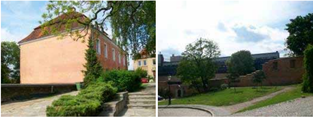
Fot. 32. Zamek Przemysła – stan obecny (fot. K. S.) Fot. 33. Mury miejskie od ulicy Ludgardy (fot. K. S.)

Warto wspomnieć, że w miejscu w którym stoi obecnie gmach Muzeum Narodowego, stała jedna z baszt armatnich muru zewnętrznego. Niestety, współczesna zabudowa miasta, powoduje, że dalszy spacer wzdłuż murów miejskich staje się niemożliwy. Muzeum Narodowe warto odwiedzić ze względu na znajdującą się tu galerię sztuki średniowiecznej liczącą przeszło sto cennych eksponatów, wśród których znaczącą jest rzeźba Chrystusa na osiołku (kon. XV w.). Następnie ulicą Paderewskiego podążamy do Placu Wielkopolskiego, skręcamy w prawo w Aleje Marcinkowskiego i docieramy (po około 10 minutach) do kolejnego obiektu na trasie – kościół Św. Marcina .