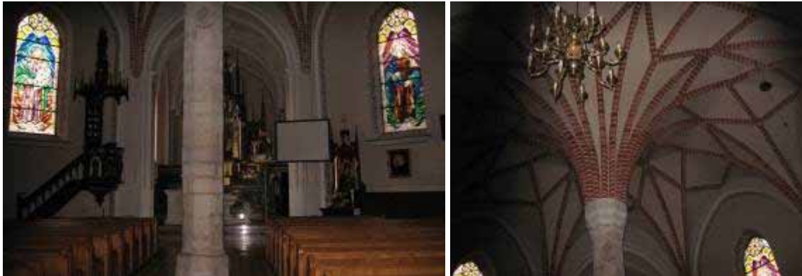
Fot. 3, 4 Wnętrze kościoła w Gosławicach

W Wielkopolsce najstarszą realizacją gotycką było nieistniejące prezbiterium katedry w Poznaniu, którego budowę rozpoczęto w 1243 roku. Jego kształt architektoniczny znany tylko z przekazów pisanych, bowiem sama budowla została rozebrana w XV wieku. Poza monumentalnymi katedrami w Gnieźnie i Poznaniu, które przebudowano z form romańskich, dużą grupę gotycką stanowią powstałe w drugiej połowie XIII wieku kościoły klasztorne (podominikański – przedkolacyjny, dominikanek-katarzynek, karmelitów trzewickowych w Poznaniu, franciszkanów i bożogrobców w Gnieźnie i Kaliszu), farne i kolegiackie (Szamotuły, Kalisz, Śrem, Środa Wielkopolska, Mogilno), parafialne (Gniezno, Pobiedziska, Kamionna, Kostrzyn, Głuszyna, Sobótka) itd. Niezwykle oryginalnym obiektem w Wielkopolsce jest XV-wieczny kościół w Gosławicach. Jest bowiem jedyną w regionie świątynią gotycką wybudowaną na planie centralnym, której sklepienie palmowe wspiera się na jednym środkowym filarze. Swą formą kościół nawiązuje zgodnie z zamierzeniem fundatora do kaplicy Grobu Pańskiego w Jerozolimie. Do połowy XVI wieku w Wielkopolsce wybudowano ok. 180 gotyckich świątyń. Wiele z nich przeszło jednak w późniejszych wiekach liczne przekształcenia. Rzadko niestety mamy więc do czynienia z czystym stylowo obiektem.