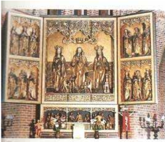
Fot. 11. Ołtarz główny katedry poznańskiej

Z elementów wystroju korespondujących ze zregotyzowaną strukturą wnętrza, należy wspomnieć przede wszystkim późnogotycki ołtarz główny (ok. 1512 r.), który trafił do poznańskiej katedry w latach powojennych z Góry Śląskiej.