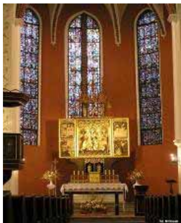
Fot. 21. Kościół św. Marcina, prezbiterium

sceny z życia św. Katarzyny. Po zniszczeniach wojennych, zrekonstruowany został, mocno uszkodzony, późnobarokowy ołtarz Serca Jezusowego z drugiej połowy XVIII wieku, stojący w nawie północnej [Kurzawa, Kuszelski 2006, ss. 160-169].