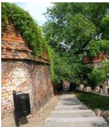
Fot. 31. Mury na Górze Przemysła (fot. K. S.)

Następnie ulicą Zamkową kierujemy się na Górę Przemysła, gdzie pozostał spory fragment zachowanych murów obronnych . W XIII wieku powstał tu zamek królewski , który włączony w ciąg obwodu murów stał się kolejnym punktem w systemie obronnym miasta i oprócz reprezentacyjnej, pełnił również funkcję militarną. Za czasów Kazimierza Wielkiego zamek należał do największych budowli świeckich w kraju. Gotycka budowla spłonęła w 1536 roku. Zmiany w następnych stuleciach przynosiły przekształcenia w duchu nowożytnych stylów. Dziś w budynku zamku, który swój obecny kształt uzyskał w 1783 roku znajduje się Muzeum Sztuk Użytkowych. Istnieje szansa odbudowy obiektu w formach historyzujących. Byłoby to niewątpliwą atrakcją dla turystów kulturowych