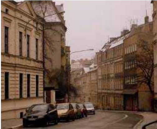
Fot. 26. Ulica Święty Wojciech

Podążając dalej na zachód, przez Most Bolesława Chrobrego i Małe Garbary docieramy na Wzgórze Św. Wojciecha (jest to dość długi odcinek do pokonania dlatego warto skorzystać z komunikacji miejskiej i podjechać jeden przystanek tramwajem spod katedry na Małe Garbary, następnie spacerem około 5 minut przez ulicę Św. Wojciech przybywamy na miejsce). Po ruchliwej i hałaśliwej dzielnicy Śródka, Wzgórze Św. Wojciecha wydaje się enklawą ciszy i spokoju.