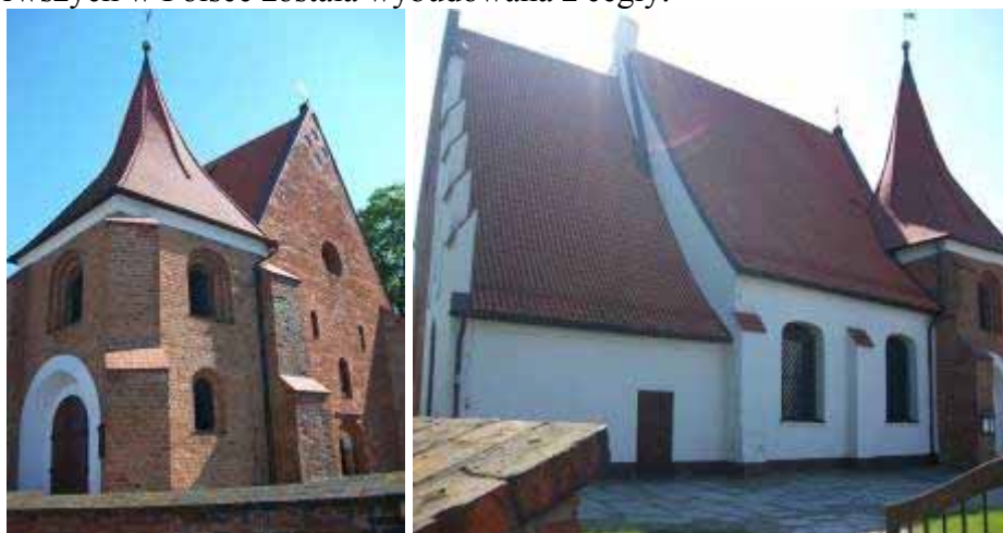
Fot. 5,6 Kościół św. Jana Jerozolimskiego

kościół, który od 1288 występuje już w źródłach pod wezwaniem św. Jana. Świątynia o proveniencjach romańskich posiada dość prostą formę, bardzo typową dla tego stylu. Jako jedna z pierwszych w Polsce została wybudowana z cegły.