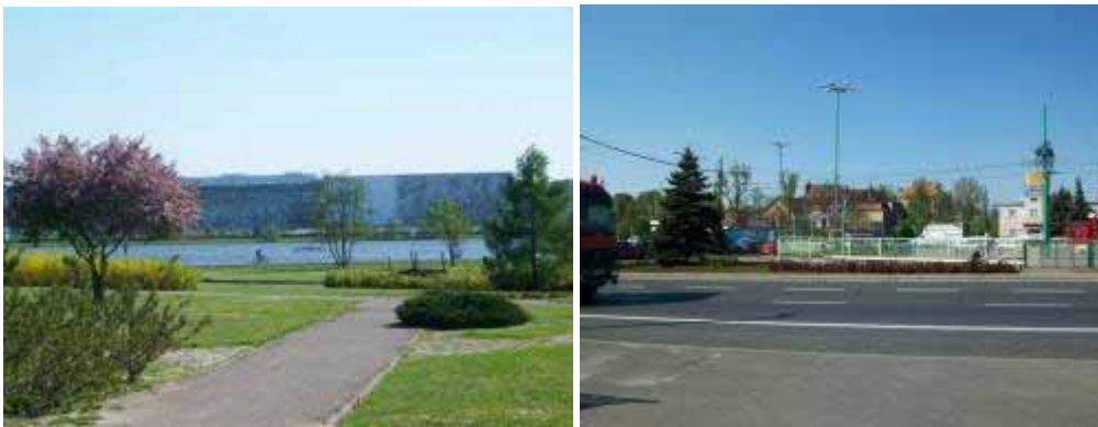
Fot. 24, 25 Teren przy kościele św. Jana

Trasę rozpoczynamy (zgodnie z przebiegiem Traktu Królewsko-Cesarskiego) od kościół Św. Jana Jerozolimskiego za Murami , położonego w dzielnicy Komandoria. Kościół znajduje się przy Jeziorze Maltańskim co jest jego dodatkowym atutem jako atrakcji turystycznej w aspekcie rekreacyjnym. Posiada bardzo dogodną lokalizację, dlatego też nie trudno tu dotrzeć (na Rondzie Śródka jest węzeł komunikacji autobusowej i tramwajowej). Następnie kierujemy się na położoną tuż obok Śródkę (najlepiej udać się tam przejściem podziemnym), dzielnicę, która od momentu powstania w XI wieku rozwijała się jako osada targowa i stąd wzięła swą nazwę – od targów odbywających się tu niegdyś w środy – Śródka.