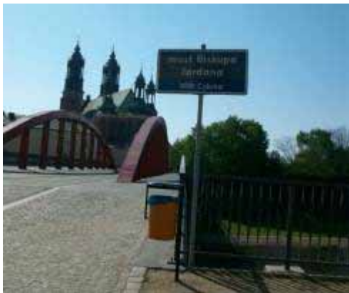
Fot. 25. Most na Cybiną, widok od dzielnicy Ostrówek

W latach 1425-1800 była odrębnym miastem. Do naszych czasów zachował się częściowo dawny układ urbanistyczny z niewielkim rynkiem, przy którym znajduje się kolejny obiekt na trasie – kościół Św. Małgorzaty Panny i Męczenników (dotarcie tu z pod kościoła Św. Jana Jerozolimskiego zajmuje około 10 minut). Następnie przez niewielką dzielnicę Ostrówek i Most Biskupa Jordana nad Cybiną docieramy (po około 5 minutach) na Ostrów Tumski – do najstarszej części miasta.