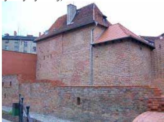
Fot. 28. Baszta Katarzynek

W odległości kilkudziesięciu metrów przy ulicy Wronieckiej znajduje się kolejny obiekt na trasie – kościół Matki Boskiej Wspomożenia Wiernych i Klasztor Salezjanów (dawny klasztor dominikanek zwanych w Poznaniu katarzynkami). Następnie kierujemy się na wschód ulicami: Mokrą i Dominikańską i po około 5 minutach docieramy do następnego punktu trasy – kościoła pod wezwaniem Najświętszego Serca Jezusa i Matki Boskiej Pocieszenia na ul. Szewskiej. Stąd już zaledwie kilkaset metrów dzieli nas od serca miasta