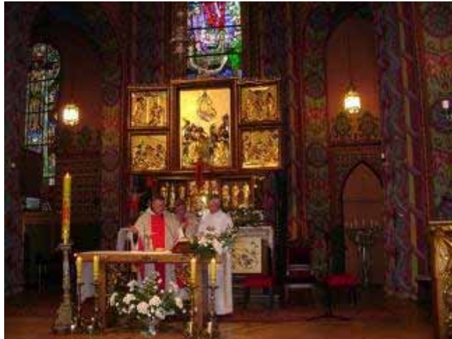
Fot. 15. Kościół św. Wojciecha, ołtarz główny

Tylko w tym kościele w Poznaniu zachowały się ołtarze inspirowane sztuką niderlandzką, drewniane, obficie złożone, bogato zdobione snycersko z charakterystycznymi dla pierwszej połowy XVII wieku motywami plastycznymi. W świątyni znajduje się też kilka wybitnych dzieł malarstwa i rzeźby. Wyjątkowy jest zespół starych szat liturgicznych, a także zbiór wysokiej klasy złotnictwa. Nie można zapomnieć poddając się urokowi gotyckiej architektury kościoła, że znany jest on także jako nekropolia zasłużonych Wielkopolan (zw. „Skalką poznańską”) [Kurzawa, Kuszelski 2006]