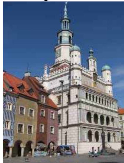
Fot. 30. Ratusz

Następnie ulicą Zamkową kierujemy się na Górę Przemysła, gdzie pozostał spory fragment zachowanych murów obronnych . W XIII wieku powstał tu zamek królewski , który włączony w ciąg obwodu murów stał się kolejnym punktem w systemie obronnym miasta i oprócz reprezentacyjnej, pełnił również funkcję militarną. Za czasów Kazimierza Wielkiego zamek należał do największych budowli świeckich w kraju. Gotycka budowla spłonęła w 1536 roku. Zmiany w następnych stuleciach przynosiły przekształcenia w duchu nowożytnych stylów. Dziś w budynku zamku, który swój obecny kształt uzyskał w 1783 roku znajduje się Muzeum Sztuk Użytkowych. Istnieje szansa odbudowy obiektu w formach historyzujących. Byłoby to niewątpliwą atrakcją dla turystów kulturowych