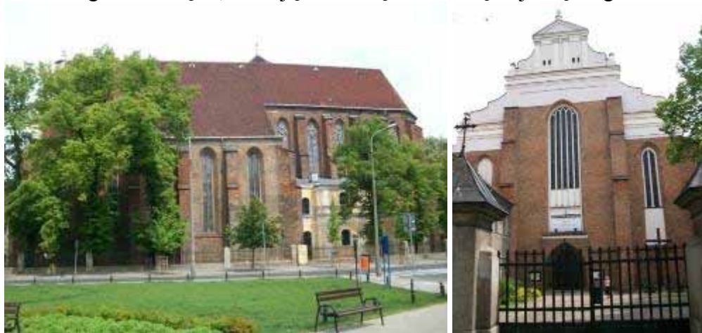
Fot. 22, 23. Kościół Bożego Ciała, widok od południa i zachodu

Założenie klasztoru karmelitów pierwotnej obserwacji, od XVII wieku zwanych powszechnie w Polsce trzewickowymi (dla odróżnienia od przybyłych wtedy do nas karmelitów zreformowanej obserwacji zwanych bosymi), jest słabo uchwytny w źródłach. Najstarsze przekazy informujące o powstaniu w Poznaniu klasztoru karmelitańskiego pochodzą z Rzymu. Pierwszym jest bulla papieska z 1400 roku zatwierdzająca założenie tu klasztoru tegoż zakonu na miejscu, gdzie czczono w szczególny sposób Eucharystię. Kolejne dokumenty papieskie przyczyniły się do ugruntowania i wzrostu sanktuarium, powstającego na dość dalekich peryferiach ówczesnego Poznania. Do osiągnięcia szczególnej pozycji w skali całego kraju przyczyniło się także zaangażowanie w fundację klasztoru króla Władysława Jagiełły. Ufundował kościół w 1406 roku pod wpływem rozwijającego się tutaj kultu Bożego Ciała. Władca traktował to sanktuarium jako miejsce nadzwyczajnej łaski, ogarniającej jego dwa złączone unią państwa. Przybywał do niego dość często, adorując czczoną tu relikwię Najświętszego Sakramentu.