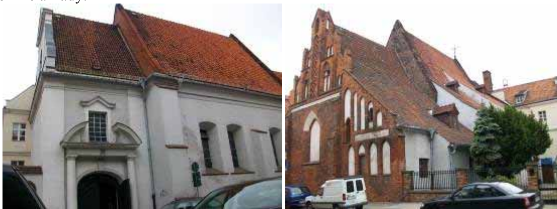
Fot. 16, 17. Kościół NMP Wspomożenia Wiernych, widok od południa i północnego-wschodu

Kościół Matki Boskiej Wspomożenia Wiernych i klasztor salezjanów (ul. Wroniecka 9) W 1282 roku miała miejsce fundacja klasztoru dominikanek, później w Poznaniu zwanych powszechnie katarzynkami. Analizując dzisiejszy kościół, można stwierdzić, że obecne prezbiterium przez pewien czas funkcjonowało samo. Nie jest ono związane murarsko z późniejszą nawą, zamknięte jest też od tej strony niezwyklej szczytem w formie arkady.