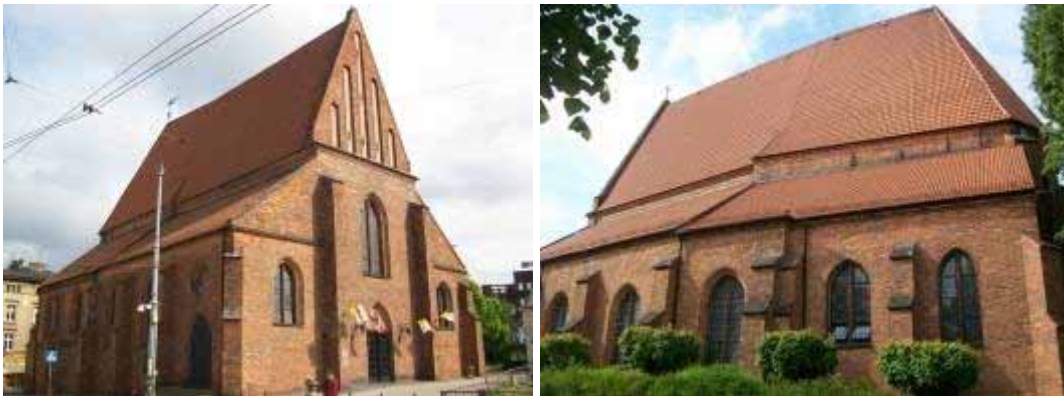
Fot. 19, 20. Kościół św. Marcina, widok od północnego-zachodu i od południa

Skromny gabarytem kościół św. Marcina leży dziś w najruchliwszej części miasta, przy ul. Święty Marcin. Mimo zdominowania świątyni przez otaczające kamienice, a w ostatnich dekadach nawet wieżowce, nie ma wątpliwości, że swoim trwaniem nadaje specyficznego ducha dzielnicy.