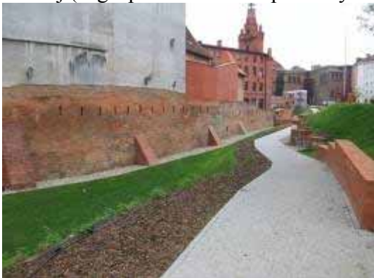
Fot. 27. Fragmenty murów północnych

części miasta. Następnie wracamy ulicą Św. Wojciech, kierujemy się na południe, przecinając ulicę Małe Garbary docieramy do pozostałości murów obronnych i Bramy Wronieckiej (dojście tu zajmuje około 10 minut). Prace przy wznoszeniu murów rozpoczęto wkrótce po lokacji miasta w 1253 roku, a zakończono pod koniec XIII lub na początku XIV wieku. Powstał wówczas pierwszy wewnętrzny pierścień murów, natomiast w XV wieku wybudowano drugi zewnętrzny pierścień. Mury miały długość około 1700 metrów, posiadały cztery bramy wejściowe (Wrocławską, Wielką, Wodną, Wroniecką) i 35 baszt. Niestety większą ich część rozebrano na początku XIX wieku. Do naszych czasów zachowały się nieliczne fragmenty w większości w warstwie archeologicznej, widoczne powyżej terenu jedynie na niewielkich odcinakach. Dzięki podjętym w 2007 roku pracom rekonstrukcyjnym i rewaloryzacyjnym wyeksponowano północny odcinek murów z pozostałościami Bramy Wronieckiej (zagospodarowane na potrzeby trasy turystycznej).