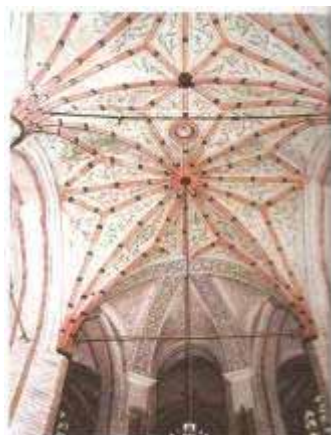
Fot. 13. Sklepienie prezbiterium

Od kilku lat, szczególnie wokół zachodniej partii kościoła, trwają intensywne prace archeologiczne zmierzające do rozpoznania palatium i kaplicy grodowej czasów Mieszka I.