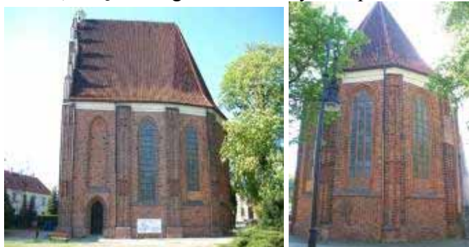
Fot. 11, 12 Kościół NMP, widok od południa i wschodu

władze administracyjne, ocaliło obiekt. Ostatecznie restauracji w duchu neogotyckim dokonano około 1860 roku, dzięki zaangażowaniu arcybiskupa Leona Przyłuskiego.