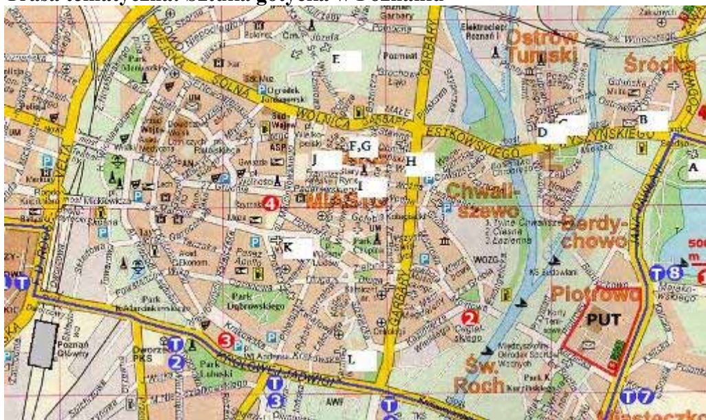
Rys. 3. Mapa trasy