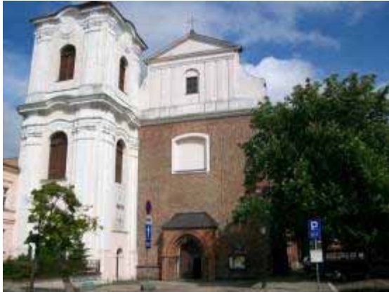
Fot. 18. Fasada kościoła poddominikańskiego (jezuitów)

jest odwiedzenia – wejścia doń przez wczesnogotycki bogato profilowany portal w fasadzie zachodniej, odsłonięty w 1923 roku. Na uwagę zasługuje, z punktu widzenia interesującego nas stylu, poza barokowym wyposażeniem jednonawowego wnętrza, przede wszystkim Kaplica Matki Boskiej Różańcowej przekryta późnogotyckim sklepieniem gwiaździstym, utrzymana w duchu neogotyckim. W ołtarzu znajduje się cudowny XVII-wieczny obraz Matki Boskiej Różańcowej otoczony kultem. Wiadomym jest, że dominikanie w Poznaniu czcili MB Różańcową już co najmniej od ok. 1441 roku. [Kurzawa, Kuszczalski 2006, ss.122-131; Poznań 1998, ss. 151-152].