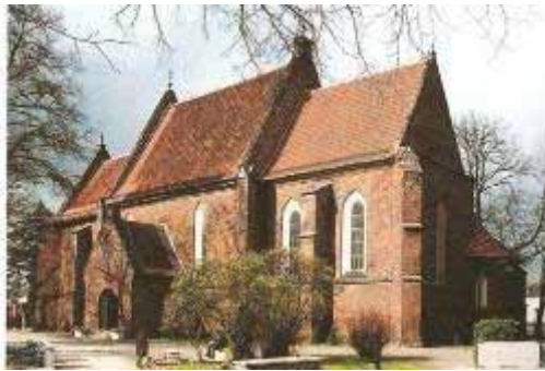
Fot. 35. Kościół św. Jakuba

arkadami: od wschodu prezbiterium, od zachodu część emporowa, dziś w połowie wypełniona chórem muzycznym. Od północy do prezbiterium przylega zakrystia i właśnie w tej kaplicy, w konstrukcji sklepienia, zwraca uwagę wysoki kunszt architektoniczny kościoła, przywodzący na myśl architekturę krzyżacką. W szczycie fasady przyciąga wzrok ostrołukowe przeźrocze biforialne [Kurzawa, Kuztelski 2006, ss.238-239].