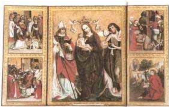
Fot. 7. Ołtarz główny, (źródło: Z. Kurzawa, A. Kuszelski Historyczne kościoły Poznania. Przewodnik , Poznań 2006)

W części centralnej – Sacra Conversatione (Święta Rozmowa) Marii z Dzieciątkiem z towarzyszeniem św. Jana Chrzciciela, patrona zakonu i św. Stanisława biskupa, patrona fundatora. Dzieło ornamentem i nowatorskim budowaniu