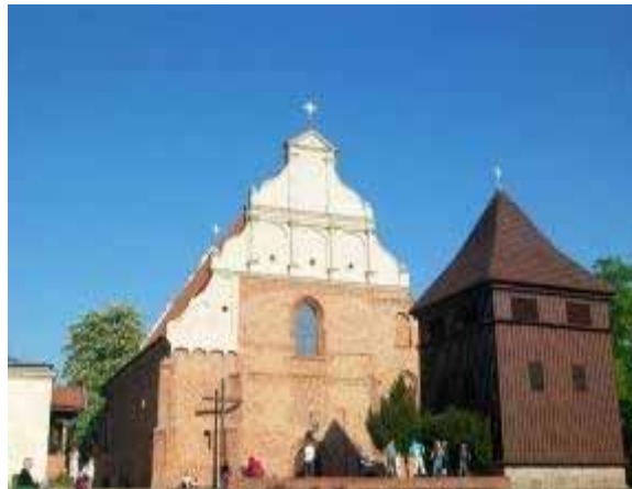
Fot. 14. Fasada kościoła św. Wojciecha z drewnianą dzwonnica

Po wielu przebudowach trwających około 200 lat ostatecznie uzyskano kościół pseudobazylikowy, z główną nawą wyraźnie wzniesioną ponad nawy boczne. Cztery zespoły sklepienne kościoła św. Wojciecha można podzielić na dwie grupy. Sklepienia w nawie północnej, a także w nawie południowej w przekroju pionowym zakreślają ostrołuk. Inaczej jest w przypadku sklepień w dawnej kaplicy Bractwa Literackiego i w głównej nawie. W pierwszym wypadku żebra jarzmowe zakreślają łuk pełny, w drugim łuk obniżony. To rozróżnienie ilustruje przełom w praktyce budowlanej. Dwa pierwsze przykłady można zaliczyć do późnych faz architektury gotyckiej. Dwa pozostałe są raczej sprawnym naśladownictwem, rodzajem neogotyku. W poznańskim kościele św. Wojciecha utrzymywano jednolitość form gotyckich, mającą dać wrażenie jednorodności całej budowli.