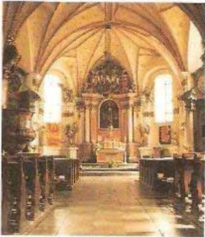
Fot. 8. Wnętrze kościoła

Z gotycką architekturą dobrze koresponduje barokowe wyposażenie świątyni wykonane w czasach filipińskich, w większości w XVIII wieku. Z drugiej ćwierci tego stulecia pochodzą m.in. ołtarz główny, ambona chrzcielnicą i balustrada chóru muzycznego. Murowane, pokryte są czerwoną marmoryzacją uzupełnioną jasnymi elementami i ornamentami o charakterze regencyjnym. Pole główne ołtarza głównego wypełnia tu współczesny ołtarzowi obraz Wniebowzięcia Najświętszej Marii Panny, pod którym znajduje się drugi wizerunek Maryjny zakomponowały z pochodzącej z XVII wieku srebrnej sukienki zdjętej z obrazu Maki Boskiej na półksiężycu i domalowanych twarzy i rąk. Ołtarzowi towarzyszą po bokach dwie pary rzeźb, z których jedna, przedstawiająca archaniołów Michała i Rafała, zwraca uwagę ekspresją i wrazeniem gwałtownego poruszenia. Wiszące przy długich filarach nawy naprzeciw siebie ambona i chrzcielnicą odpowiadają sobie formą. Obie mają taką samą dekorację, a ich czasze zespolone są konchowymi zapleckami zwieńczonymi baldachimami. Na zaplecku chrzcielnicą umieszczona została stiukowa scena wizji św. Filipa Neri w ołtarzu z około połowy XVIII wieku w kaplicy poświęconej temu świętemu, ufundowanej w 1652 roku przez ks. Stanisława Grudowicza. Wykonawstwo tej wysokiej klasy rzeźby wiązane jest ze sztukatorami śląskimi Janem Siegwitzem i Ignacym Provisore, którzy zaangażowani byli do prac przy ołtarzu głównym w filipińskim kościele na Świętej Górze w Gostyniu-Głogówku.