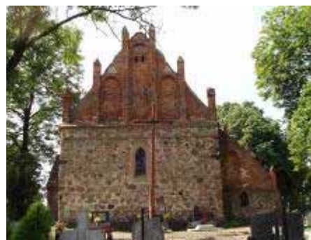
Foto 15. Harmonijna elewacja wsch. kościoła w Brudzawach.

Wyposażenie świątyni, głównie XVIII i XIX w., nie jest szczególnie godne uwagi (KZSP, t. XI.2, s. 24 – 25. Zob. też TST).