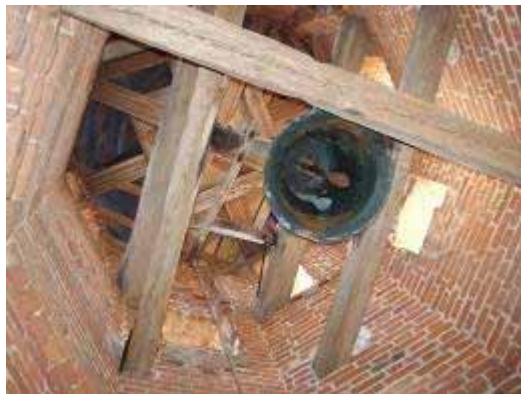
Foto 21. Wnętrze górnej kondygnacji, pełniącej funkcję dzwonnicy wieży kościoła w Kurkocinie.