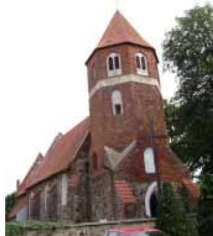
Foto 7. Widok ogólny kościoła w Nowej Wsi Królewskiej od pd.-zach.

Obejrzawszy kościół płużnicki, wyruszamy drogą wojewódzką nr 548 do Lisewa (ok. 6 km). W centrum tej dużej, wzmiankowanej od 1288 r. wsi, patrząc w kierunku jazdy po prawej stronie, na niewielkim, otoczonym murem i zajęтым przez cmentarz wyniesieniu, gotycki, orientowany kościół p.w. Podwyższenia Krzyża Św. i NMP Śnieżnej wzniesiony zapewne w 4 ćw. XIII w. Znacznie przebudowany z fundacji Stanisława i Jana Kostków przez muratora Jana Busadzii (?) w l. ok. 1551 – 1585. Wówczas to m.in. dobudowano masywną, efektownie dekorowaną blendami, opaskowymi fryzami i półszczytami część zach. korpusu wraz z wieżą (Foto 8.). Obiekt następnie wielokrotnie odnawiano. Dziś prezentuje się nam salowa budowla z wyodrębnionym prezbiterium. Wzniesiona z kamienia polnego, łamanego granitu i cegły. Ciekawie ukształtowany szczyt prezbiterium, schodkowy, dekorowany