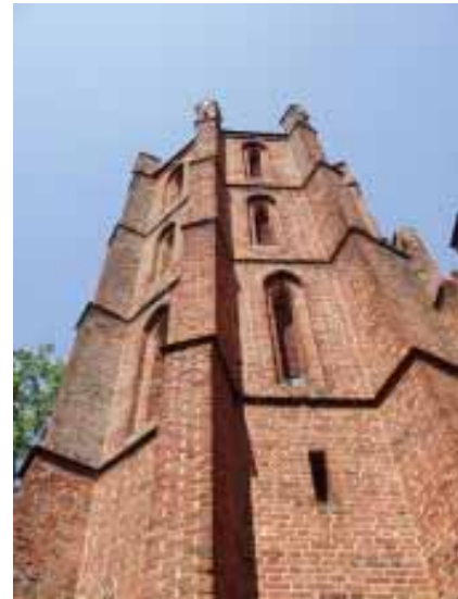
Foto 2. Wieża kościoła w Lembargu, ujęcie od pd.

Oczywiście na przestrzeni wieków wiele z wymienionych kościołów poddawanych było różnorodnym przebudowom. Zasadniczo jednak nie zniekształciły one brył i ogólnego architektonicznego charakteru, choć za to niejednokrotnie pozbawiły obiekty oryginalnego detalu architektonicznego 15 . Często zaś w sposób mniej lub bardziej interesujący wzbogaciły je, stając się cennym świadectwem stosunku do materii zabytkowej w przeszłości. Oczywiście estetyczne walory wspomnianych przekształceń mogą być przedmiotem dyskusji. Zapewne puryści z chęcią usunęliby nawarstwienia, starając się przywrócić „oryginalny”, XIII- czy XIV-wieczny kształt obiektów, tak jak to można w sposób aż nadto dobitny zobaczyć w realizacjach konserwatorskich, którym poddano ostatnio szereg barokowych ołtarzy z kościołów toruńskich (czy też u św. Anny w Radzynie Chełmińskim). Osobiście, mając w pamięci słowa Michela Pastoureaux 16 , uważam te wszystkie architektoniczne dodatki za element dodający poszczególnym obiektom uroku i świadczący o ich bogatych, niejednokrotnie tragicznych dziejach. Również z tego względu gotyckie kościoły Ziemi