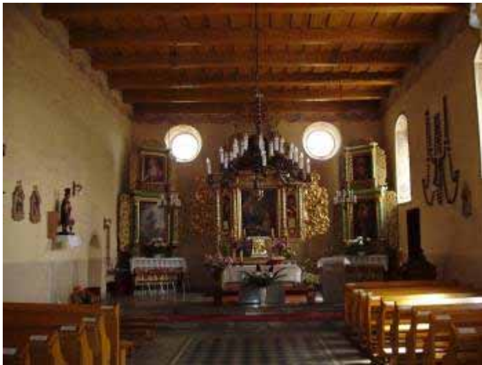
Foto 16. Wnętrze kościoła w Osieczku, typowy przykład gotyckiej budowli salowej przebudowywanej i wyposażanej w późniejszych okresach.

Z Osieczka lokalnymi drogami udajemy się w kierunku południowo-wschodnim do sporej, gminnej wsi Dębowa Łąka (ok. 4 km). Przy drodze do Łobdowa, niedaleko centrum, stoi kościół p.w. śś Piotra i Pawła. Nie należy on może do grona najpiękniejszych i najefektowniejszych w Ziemi Chełmińskiej, zwraca jednak uwagę kilkoma rzeczami. Jest to budowla orientowana, salowa, wzniesiona na przełomie XIII/XIV w., a następnie po zniszczeniach Wielkiej Wojny odbudowana i znacząco przekształcona w początkach XVII w. Uderzający jest kontrast pomiędzy wyjątkowo surową bryłą kamiennego korpusu, którego północna elewacja w ogóle pozbawiona jest otworów okiennych, a wysokim czternastowiecznym (choć nieznacznie przekształconym w w. XVII) schodkowym, ceglany szczytem wschodnim oraz monumentalną, zbudowaną na planie kwadratu wieżą. Szczyt wschodni dekorowany jest pięcioma blendami, sześcioma ustawionymi przekątnie sterczynami oraz znajdującymi się między nimi trójkątnymi szczycikami. Umieszczona od zach. wieża posiadają oryginalną, powstałą głównie w pocz. XVII w. artykulację. Jej dolną, całkowicie kamienną kondygnację zdobi wyłącznie ostrołukowy, wykonany z profilowanej cegły, uskokowy portal. Wyższa kondygnacja posiada dekorację składającą się z trzech w każdej elewacji blend, zaś dwupiętrową najwyższą kondygnację zdobią wysokie wnęki zamknięte zdwojonymi łukami. Całość wieńczy atyka i wysoka ceglana iglica. (Foto 17. zob. też foto 1.)