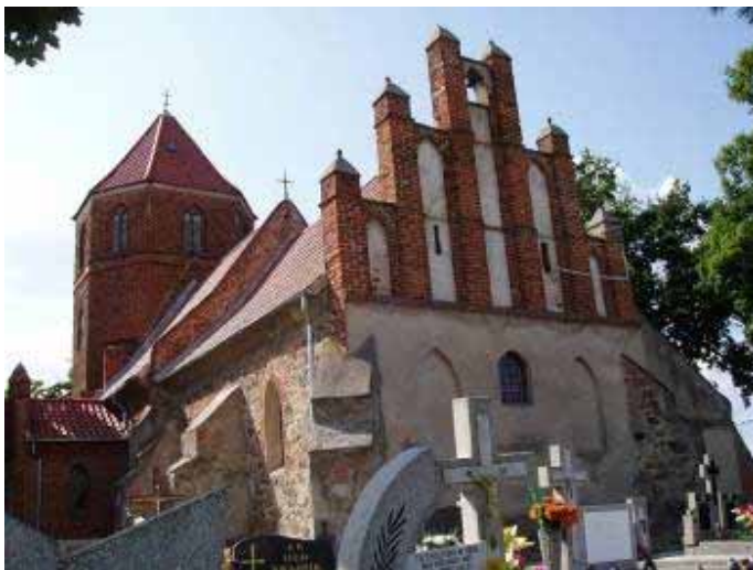
Foto 25. Widok kościoła w Niedźwiedziu od pd.-wsch.

Kościół w Niedźwiedziu jest jednym z ciekawych i wcale licznych przykładów łączenia przez mistrzów budowlanych kamienia, z którego wzniesiono jego dolne partie, oraz cegły służącej w znacznej mierze jako materiał do wykonania elementów dekoracyjnych (szczyt wschodni, portale) (Foto 25). Na uwagę zasługuje też dość typowa, lecz ciekawa, umiejscowiona od zachodu wieża, o dolnej kondygnacji kwadratowej, a górnej ośmiobocznej (Foto 26).