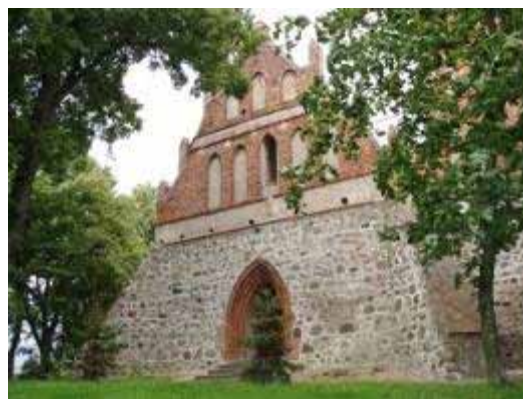
Foto 3. Zachodnia elewacja kościoła w Wabczu.