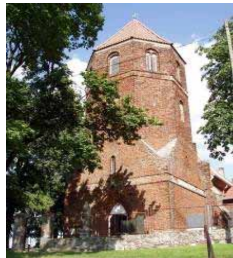
Foto 26. Wieża kościoła w Niedźwiedziu.

Ciekawe wyposażenie, głównie barokowe, jednak z elementami gotyckimi.