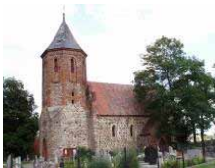
Foto 14. Ogólny widok kościoła w Brudzawach od pd.-zach.