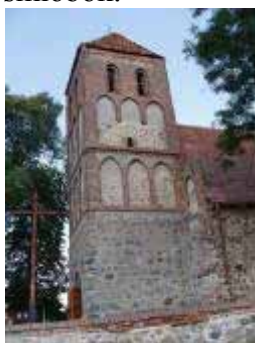
Foto 13. Wieża kościoła w Kruszynach, widok od pn., z podwórca plebanii.

Opuszczamy Kruszyny i udajemy się drogą lokalną na Książki, a następnie – po ok. 1 km – skręcamy w lewo na Brudzawy (łącznie ok. 3 km). We wsi kościół gotycki p.w. św. Andrzeja Apostoła. Orientowany, salowy, prostokątny z zakrystią, kruchtą i wieżą (Foto 14.). W dolnych partiach z kamienia, w górnych ceglany. Surową bryłę ożywia trójkątny szczyt wschodni dekorowany sześcioma sterczynami i trzema blendami umiejscowionymi w centralnych polach szczytu. Jego płynnym przedłużeniem jest szczyt zakrystii, dekorowany trzema niewielkimi fialami i blendą. Całość elewacji wschodniej tworzy w rezultacie harmonijną, choć surową całość (Foto 15.). Wieża kościoła, umiejscowiona w jego zachodniej części, reprezentuje typ dość często spotykany w Ziemi Chełmińskiej. Jest w dolnej partii czworoboczna, a nieco powyżej fryzu wieńczącego korpus płynie przechodzi w ośmiobok.