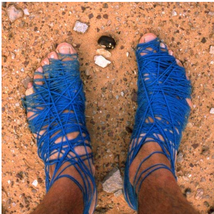
Ryc. 6.

Sławomir Brzoska - artysta i pedagog poznańskiej ASP wezwanie do podróży przyjął bardzo dosłownie. W latach 2007-2008 zrealizował projekt artystyczny, który polegał na objechaniu samotnie kuli ziemskiej. Podczas Roku Wędrującego Życia , zaczynając od Ameryki Południowej, poprzez Oceanię, Australię i Azję odwiedził 23 kraje pokonując ponad 100 000 kilometrów.