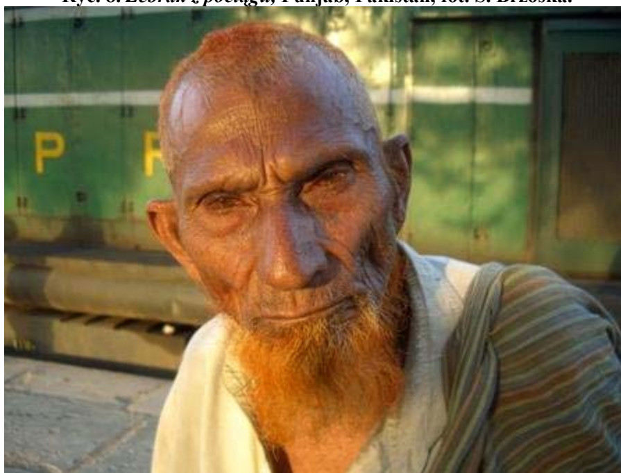
Ryc. 8. Żebrak z pociągu, Punjab, Pakistan, fot. S. Brzoska.

pozostawiał po sobie w różnych miejscach świata nie ingerencyjne, szybko ulegające zatarciu ślady wędrowca. Oplecione włóczką kamienie – ślady wędrowki, szybko odzyskiwały dawny kształt. Włóczka znikła niszczone przez wiatr, deszcz i słońce, a kamień pozostawał nietknięty. Jego artystyczne działania zbliżyły się w tym znaczeniu do życia natury. Podobnie jak u Longa, działania, formy i kształty rozpraszały się z czasem w krajobrazie jak odzwierzęce ślady znaczeń terenu. Miejsce pozostawało gotowe do wtórnego zagospodarowania przez innego wędrowca. Ślady rzeczowe znikły, zostawały ślady emocjonalne, dzięki którym artysta doświadczał przekraczania własnego ja, tego, co indywidualne, jednostkowe i niepowtarzalne.