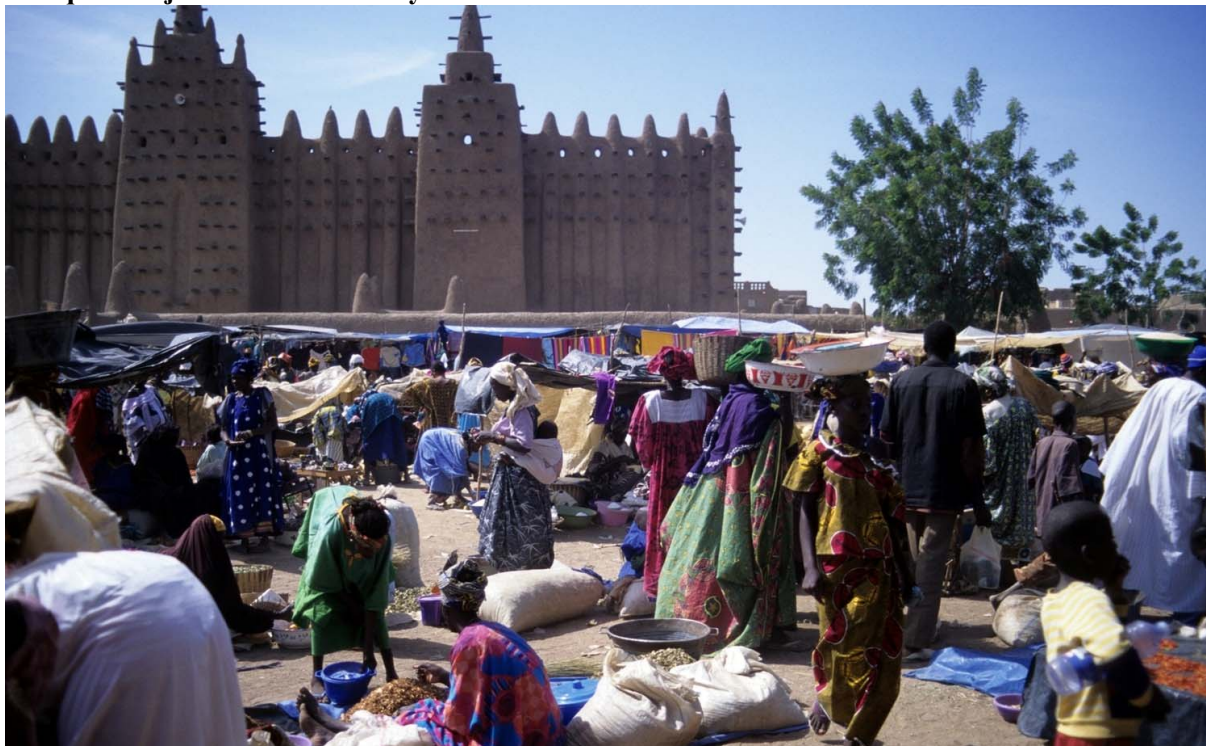
Ryc. 3. Plac przed Wielkim Meczetem w Djenne w dzień targowy. / The square of the Grand Mosque in Djenne on market day

Źródło: fot. Sylwia Kulczyk, Djenne (Mali), listopad 1998.