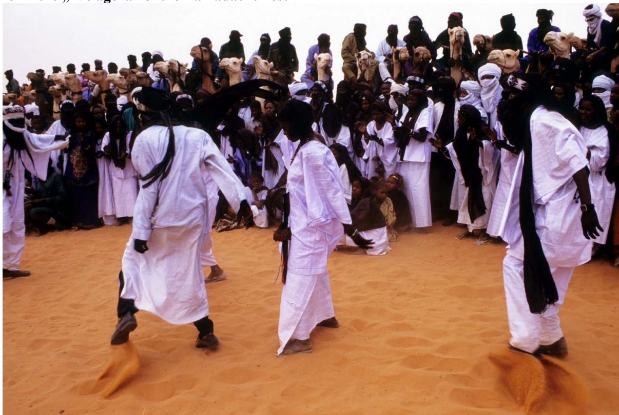
Ryc. 5. Dromadery Tuaregów formują „żywą agorę” festiwalu Tamadacht. / Tuareg’s camels form the „live agora” of the Tamadacht Fest

Źródło: fot. Sylwia Kulczyk, Anderamboukane (Mali), styczeń 2009.