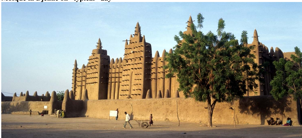
Ryc. 4. Plac przed Wielkim Meczetem w Djenne w „zwykły” dzień. / The square of the Grand Mosque in Djenne on “typical” day

Źródło: fot. Sylwia Kulczyk, Djenne (Mali), listopad 1998.