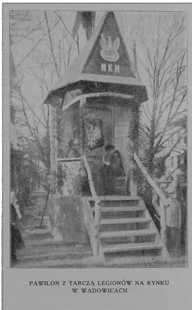
Pocztówka z 1915 r.

Na przełomie listopada i grudnia 1917 roku do jednostek austriackich walczących na froncie włoskim - w tym do 56 pułku piechoty - wcielono byłych legionistów - poddanych austriackich. Chociaż nie uznano im stopni wyniesionych z Legionów i przeznaczono w większości jako szeregowców do pierwszej linii, szybko zaczęli odgrywać znaczącą rolę w budowaniu patriotycznych i antyaustriackich nastrojów wśród żołnierzy. Nawiązali również kontakt z najbardziej niepodległościowo zorientowanymi oficerami i rozpoczęli