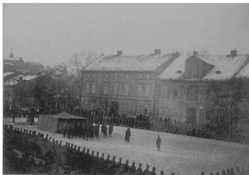
Wymarsz marszbatalionu 56pp z Wadowic. Górny Rynek 1916 r.

w mieście i najbliższej okolicy udało się zapobiec rozruchom i niepokojom. Z powodu braku wojska i policji w wielu miejscowościach powiatu doszło jednakże do przejściowego rozprężenia i opanowania terenu przez grupy dezertersów z byłej armii austriackiej, tzw. „zielone brygady” wataśające się od wielu miesięcy po całej Galicji, czy też przez zwykłe bandy rabunkowe wykorzystujące ogólny chaos dla bogacenia się. Część ludności dawała też posłuch hasłom antysemitkim, sami zaś Żydzi w obawie przed utratą majątku czy życia zamykali swe sklepy i odmawiali sprzedawania towarów, co z kolei dezorganizowało życie lokalnych społeczności w większości od żydowskich handlowców uzależnione. Do zamieszek i napadów doszło m.in. w Andrychowie, Zatorze i rejonie Brzeźnicy. Sytuację uspokoił dopiero powrót wojsk garnizonu wadowickiego - Kadry Zapasowej z Kielc a formacji liniowych z frontu włoskiego, co nastąpiło w drugiej połowie listopada.