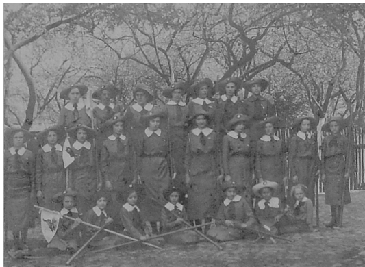
Drużyna skautek w Wadowicach. 3 maja 1914 r.