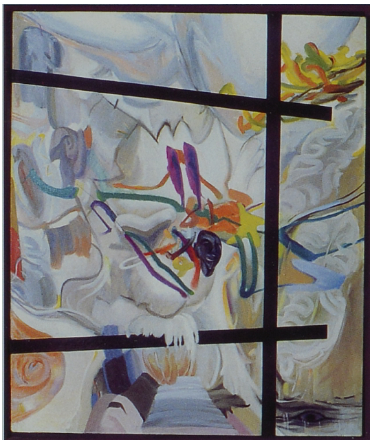
Karol Pustelnik Przeistoczenie, 1978 r., olej.