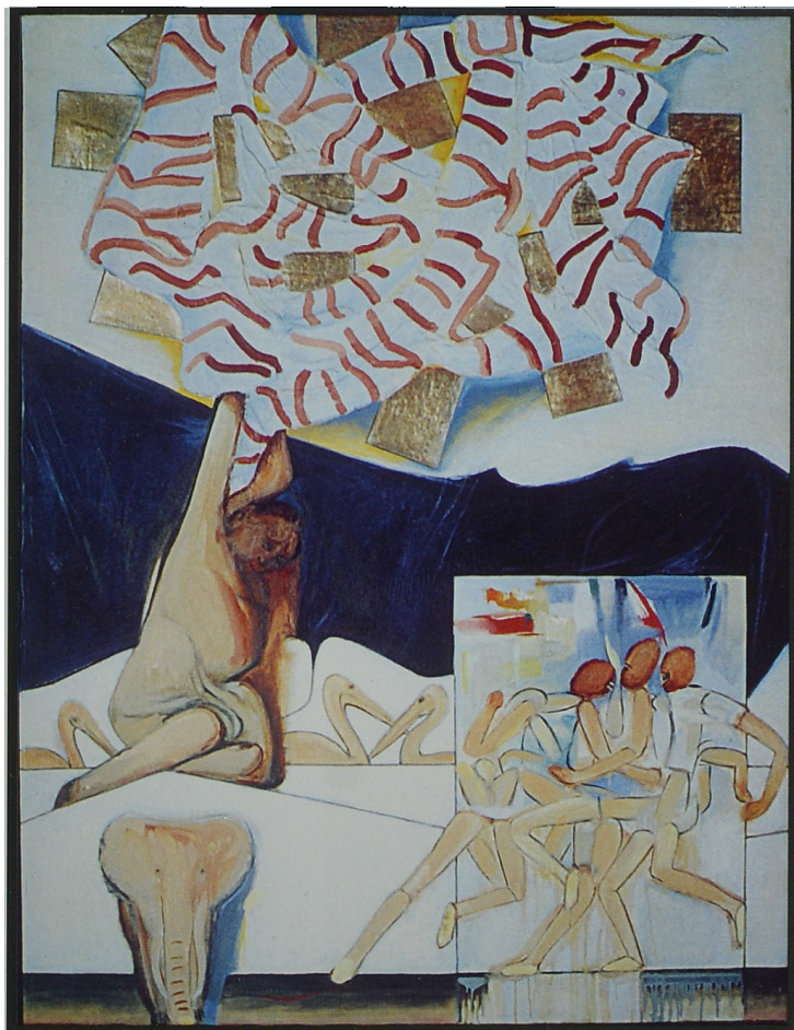
Karol Pustelnik Własne podwórko, 1968 r., olej, aluminium.