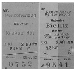
Bilety kartonikowe z lat 1943 i 1944 z wydrukowaną nazwą Wadowice w jęz. polskim.

dopodobniej oszczędni Niemcy zużywali zachowane przedwojenne kartoniki. Znałe są również dokumenty, na których występuje niemiecka pieczęć nagłówkowa z napisem „Bahnhof Wadowice” mimo, iż użyta na tym samym formularzu pieczęć okrągła z godłem III Rzeszy, tzw. „gapa” czy „wroną” ma w otoku napis: „Deutsche Reichsbahn - Bahnhof Wadowitz”. To już raczej dowód... niemieckiego braku konsekwencji.