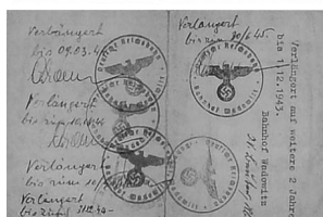
Okupacyjna legitymacja służbowa Józefa Dzięwiła.