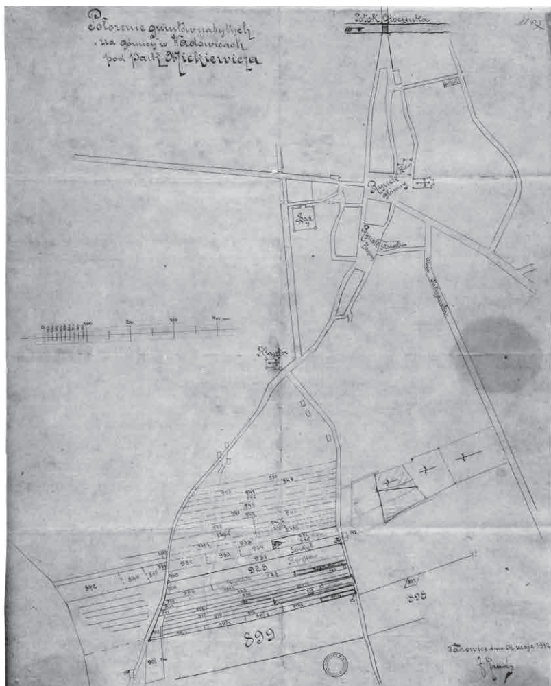
Fot. 3 – Plan gruntów nabytych na „Górnicy” w Wadowicach, z przeznaczeniem pod park miejski im. A. Mickiewicza – maj 1912 r..

wnioskować, iż, mimo wykupu gruntów w tym rejonie miasta pod przyszły park rekreacyjno – wypoczynkowy, nie planowano rozpocząć jego instalacji przed rokiem 1912. Tak więc dopiero reaktywacja TUMWiO przyspieszyła realizację koncepcji budowy parku miejskiego. W dniu 24 maja 1912 r. sporządzony został zarys mapy katastralnej parceli nabytych uprzednio przez miasto na „Górnicy”