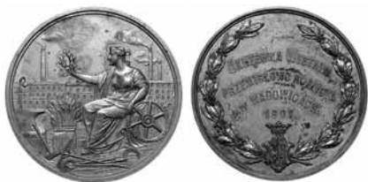
Fot. 5. Medal Okręgowej Wystawy Przemysłowo-Rolniczej w Wadowicach, 1907 r.