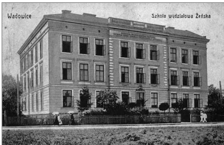
Fot. 2. Gmach Żeńskiej Szkoły Wydziałowej przy ulicy Długiej w Wadowicach.

wana w dniu 7 września 1907 r., czyli – jak wówczas sądzono – jeszcze w trakcie trwania wystawy. Faktycznie loteria ta odbyła się dopiero 7 października 1907 r. 46