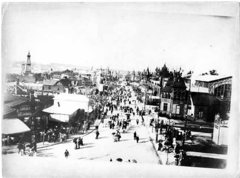
Fot. 1. Powszechna Wystawa Krajowa we Lwowie w 1894 r. (fotografia ze zbiorów własnych autora).

lokalne wystawy zorganizowano m.in. w Tarnowie w 1904 r. oraz w Przemyślu, dwa lata później 21 .