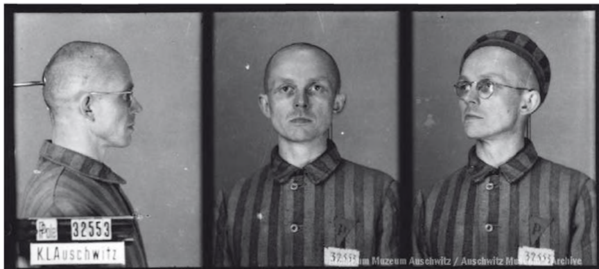
Lucjan Stanisław Paszyński

z Zofią Issmer i mieszkał z rodziną w Krakowie, początkowo przy ul. Sienkiewicza, a później na Krzemionkach przy pl. Lasoty 4 m. 2 36 .