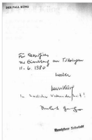
Ilustracja 1. Dedykacja Hansa Künga