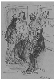
Rysunek L. Jacha (juniora)