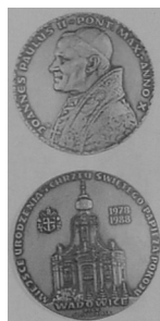
Medale wybite z okazji X-lecia Pontyfikatu Jana Pawła II