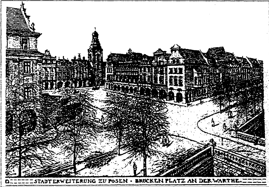
Ryc.3 Plac przy nowym moście przez Wartę - projekt nie zrealizowany

waniu nowe gmachy Dyrekcji Kolei i Prezydium Policji. Oprócz tego dotąd zostało wzniesionych siedem budynków wojskowych i 9 prywatnych, w tym bank Reiffeisenhaus i mieszkanie służbowe Prezesa Konsystorza i generalnego Intendenta.