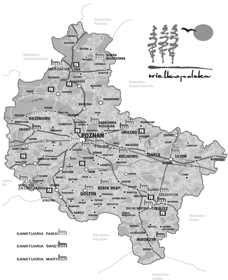
Rys. 1. Miejsca pielgrzymkowe w Wielkopolsce

Nawiązuje kontakty z przejawami bardzo wielu religii zarówno starożytnych, jak i dziś funkcjonujących” 9 .