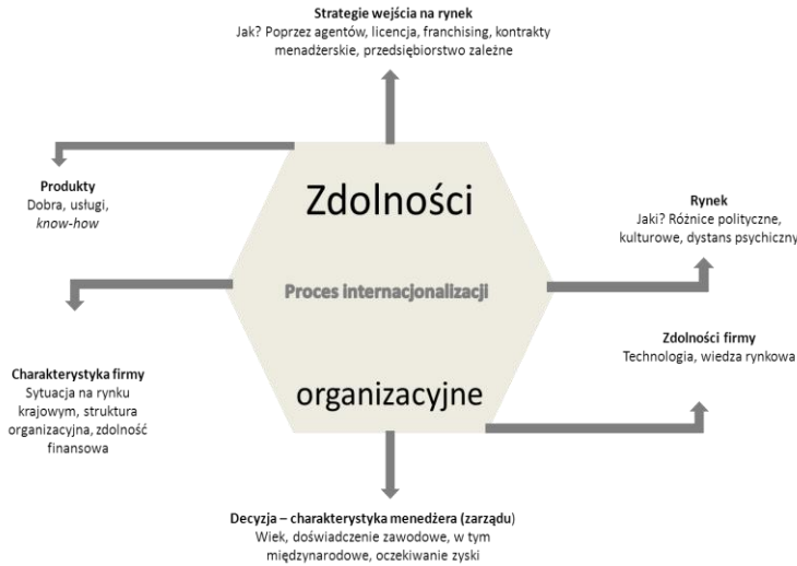
Rysunek 1. Wymiary internacjonalizacji

Źródło: opracowanie własne na podstawie: S. Chetty, Dimensions of Internationalization of Manufacturing Firms in the Apparel Industry , „European Journal of Marketing” 1999, nr 33 (1/2); T. Vissak, The Internationalization of Foreign-owned Enterprises in Estonia: A Network Perspective , Dissertations Rerum Oeconomicarum universitatis Tartuensis, Tartu 2003, s. 26.