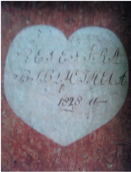
Ryc. 1. Obwoluta katalogu biblioteki bernardynów w Cudnowie, 1817–1829. Narodowa Biblioteka Ukrainy im. V. I. Vernadskiego, f. I, 4710