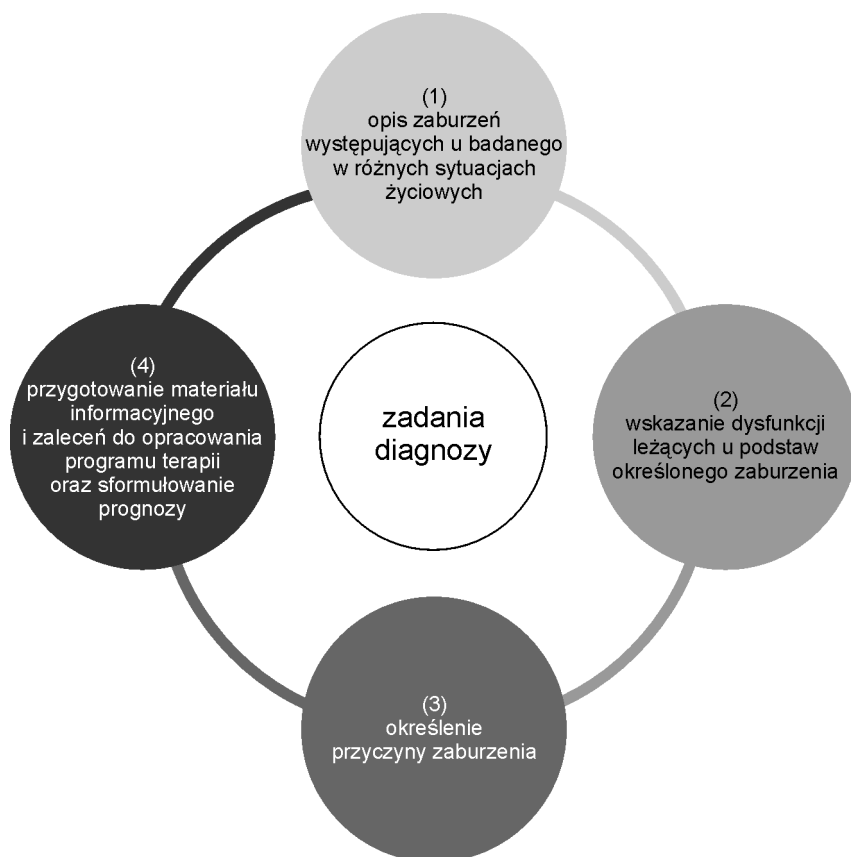
RYSUNEK 2. Zadania diagnozy w ujęciu funkcjonalnym

Konieczne jest w tym miejscu ukazanie kontekstualnego problemu diagnozy logopedycznej. Logopedia – jako nauka interdyscyplinarna – jest współtworzona z dziedzinami, z jakim najczęściej i najściślej współpracuje. Jak wskazują np. Irena Styczek 8 , Grażyna Jastrzębowska 9 , teoria logopedii oparta jest przede wszystkim na językoznawstwie – filologii języka ojczystego (w jakim jest tworzona logopedia), pedagogice, psychologii oraz medycynie. Można uznać, iż są to cztery filary, na jakich opiera się logopedia. Te filary warunkują modele diagnozy, a przede wszystkim terapii (rys. 3.).