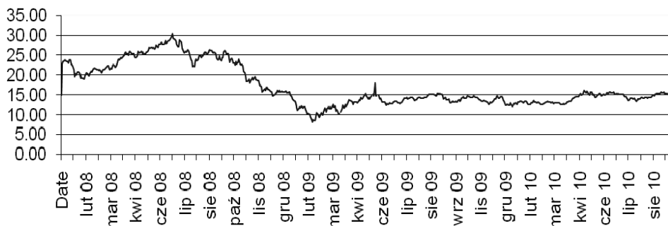
Rys. 2. Uśrednione notowania dzienne jednostki emisji CO 2 (oś rzędnych – euro/tCO 2 ) na giełdzie ECX/ICE w okresie od 1.01.2008 do 30.09.2010 (oś odciętych – czas, kwartały)

Od 2013 roku będą obowiązywały nowe zasady przydziału uprawnień. Dla polskiej elektroenergetyki zawodowej przydziały bezpłatnych uprawnień będą sukcesywnie zmniejszane, a brakujące uprawnienia będą musiały być dokupywane na aukcjach. Szczegółowe zasady funkcjonowania nowego systemu przedstawiono w opracowaniu [11]. Według [2] średnia cena uprawnień do emisji CO 2 , obliczona na podstawie najbardziej realnego scenariusza do roku 2020, wyniesie 30 euro/tCO 2 .